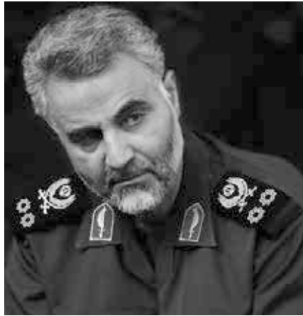
Qasem Soleimani-Kommandeur der Quds Force der Armee der Wächter der Islamischen Revolution (IRGC). Bild 4 : iran-3854254_1280.jpg

Das letztendliche Ziel ist, Shanghai mit dem östlichen Mittelmeer zu verknüpfen – auf dem Landweg, über das Herzland.