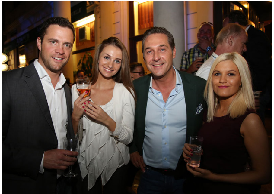
Strache und Gudenus bei einer Wahlparty der FPÖ 2014