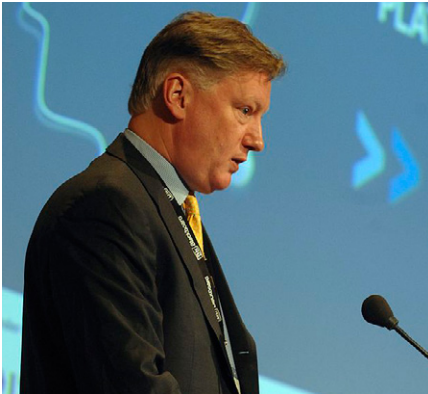
Als eine Art „Führungsoffizier“ der deutschen Zelle der „Integrity Initiative“ fungiert der geleakten Papieren zufolge der Brite Harold Elletson, der laut der britischen Zeitung „Observer“ früher als Agent des britischen Auslandsgeheimdienstes MI6 in Osteuropa und auf dem Balkan tätig war. (Foto: Online Educa Berlin 2007 - Opening Plenary, November 29, 2007, Harold Elletson (Foto: Peter Himself, commons.wikimedia.org, CC BY 2.0 DE)

wenn ihre eigenen Medien, „Komiker“ und „Künstlergruppen“ kurz vor der EU-Wahl einen solchen Coup vorbereiten. Ehemalige BND-Chefs zeigten sich in den Medien gleichwohl überrascht [28] und verwiesen stattdessen auf den Mossad, allerdings ohne dies zu belegen [29].