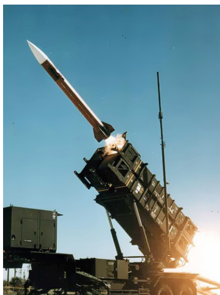
Rakete vom Typ w:de:MIM-104 Patriot..

So fand beispielsweise das Center for Studies in Communication der Universität von Massachusetts heraus, dass die Menschen umso weniger über die Hintergründe des Golfkrieges von 1991 wussten, je häufiger sie während der Krise vor dem Fernseher gesessen hatten, und dass sie auch den Krieg umso entschiedener bejahten. Bei der Frage nach Grundkenntnissen über die Region, die Politik der USA und die Ereignisse, die zu diesem Krieg geführt hatten, stellte das Forscherteam fest, dass „die auffälligsten Wissenslücken bei den Menschen solche Informationen