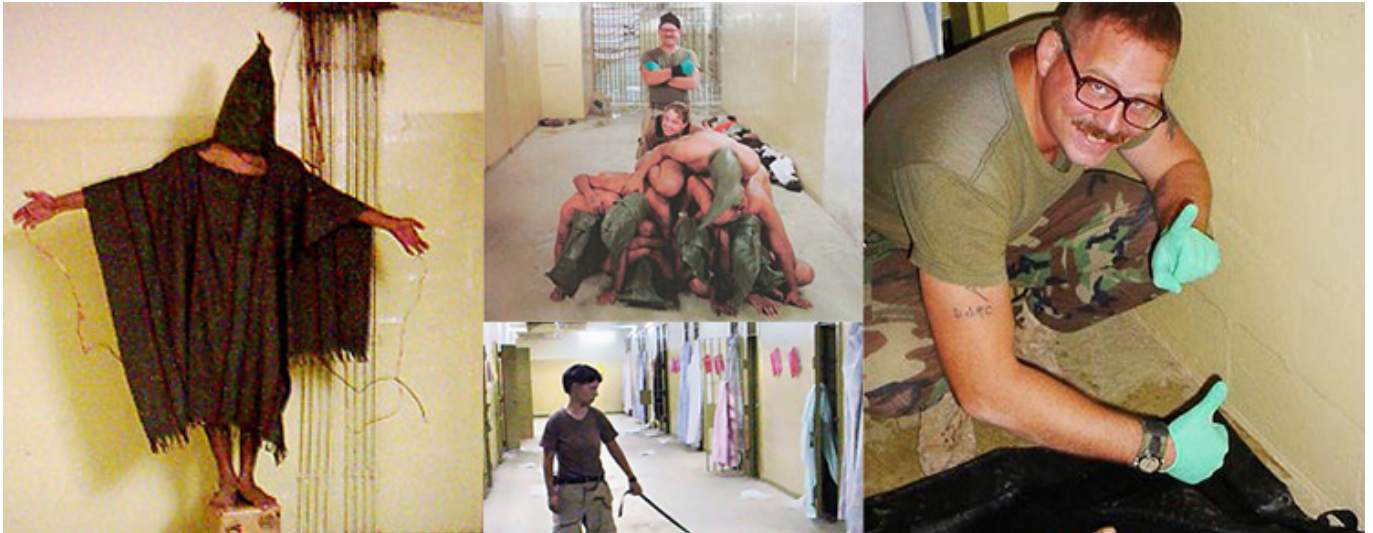
Bilder, die als Mahnmal der Schande um die Welt gingen und doch nur die Spitze des Eisbergs waren: Der Abu-Ghraib-Folterskandal.