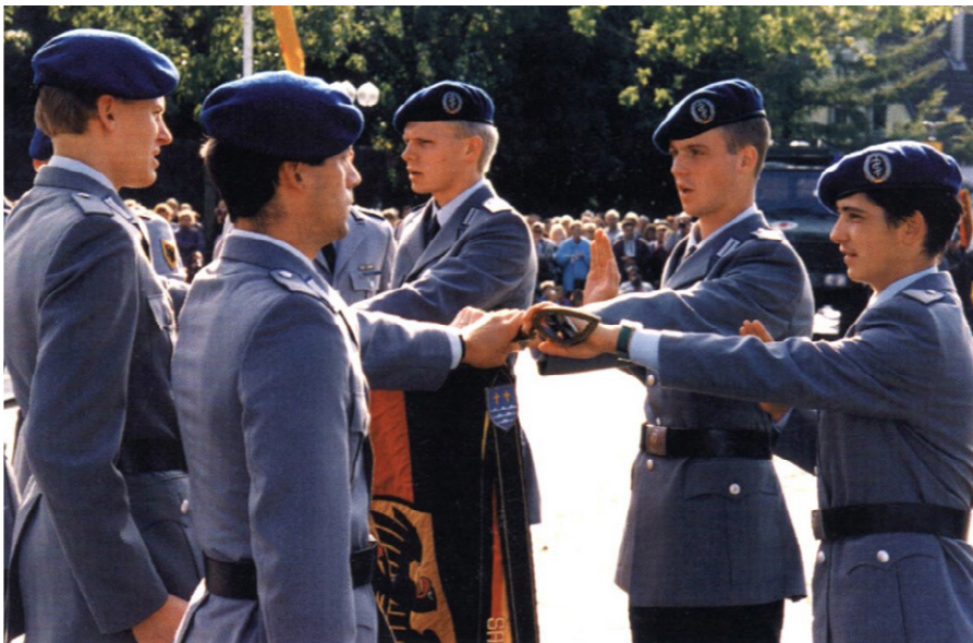
Das RekrutInnengelöbnis in der „Öffentlichkeit“ (50). Eine Abordnung der Rekruten tritt vor und spricht den Gelöbnistext mit einer Hand an der Flagge: „Ich gelobe, der Bundesrepublik Deutschland treu zu dienen und das Recht und die Freiheit des deutschen Volkes tapfer zu verteidigen.“ Im Hintergrund stehen zivile Angehörige und ausgewählte Waffensysteme. Quelle: https://www.rubikon.news/artikel/der-krieg-um-unsere-kopfe , Foto: Rubicon, Lizenz: CC-BY-NC-ND 4.0

Heute, nachdem auch für die Bundeswehr eine Präventivkriegsdoktrin in den verteidigungspolitischen Richtlinien zugrunde gelegt worden ist – wenn auch in verklausulierter Form als im US-amerikanischen Vorbild [40] –, ist Kriegführung als Mittel der Politik auch in Deutschland wieder selbstverständlich. Mehr noch: Sie findet entgegen der philanthropisch-staatspazifistischen Rhetorik auch kontinuierlich statt, während es gleichzeitig gelingt, bundesweite Demonstrationen als Unterstützung von Regierungspolitik zu interpretieren.