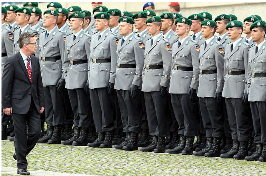
Bundesverteidigungsminister Thomas de Mezieres inspiziert die Ausbildung der Rekruten der Bundeswehr.

spielsweise den Erscheinungen der Mode – mittels einer als ritualisierte Praxis angelegten visuellen Repräsentation Einfluss auf die gesellschaftliche Symbolik zu nehmen vermögen, die zuvor diagnostizierten Kerndimensionen also vereinen.