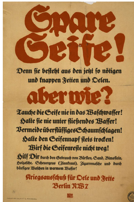
Deutsches Plakat ruft während des Ersten Weltkrieges zur Einsparung von Seife durch die Bevölkerung auf. (Plakat: Lucian Bernhard, artist, 1883–1972, gemeinfrei)

In Wirklichkeit erleben wir ein massives Artensterben [1], wie es die Welt seit dem Ende der Dinosaurier vor 65 Millionen Jahren nicht mehr gesehen hat, wobei jeden Tag etwa 200 Arten aussterben [2]. Das gesamte, uns umgebende Ökosystem, aus dem wir hervorgegangen sind, verschwindet vor unseren Augen. Mehr als die Hälfte der weltweiten Tierwelt [3] ist in den letzten 40 Jahren verschwunden, und die weltweite Insektenpopulation ist um bis zu 90% zurückgegangen [4]. Fruchtbare Böden verschwinden [5], ebenso wie Wälder [6]. Die Ozeane ersticken [7], 90% der weltweiten Fischbestände sind entweder vollständig leer gefischt oder überfischt [8], die Meere sind voll von Mikroplastik [9], und Phytoplankton, eine unverzichtbare Grundlage der Nahrungskette der Erde, wurde seit 1950 zu 40 Prozent vernichtet [10]. Die Wissenschaft hat immer wieder gezeigt [11], dass die globale Erwärmung schneller stattfindet als vorhergesagt [12], und es gibt selbstverstärkende Erwärmungseffekte [13], die