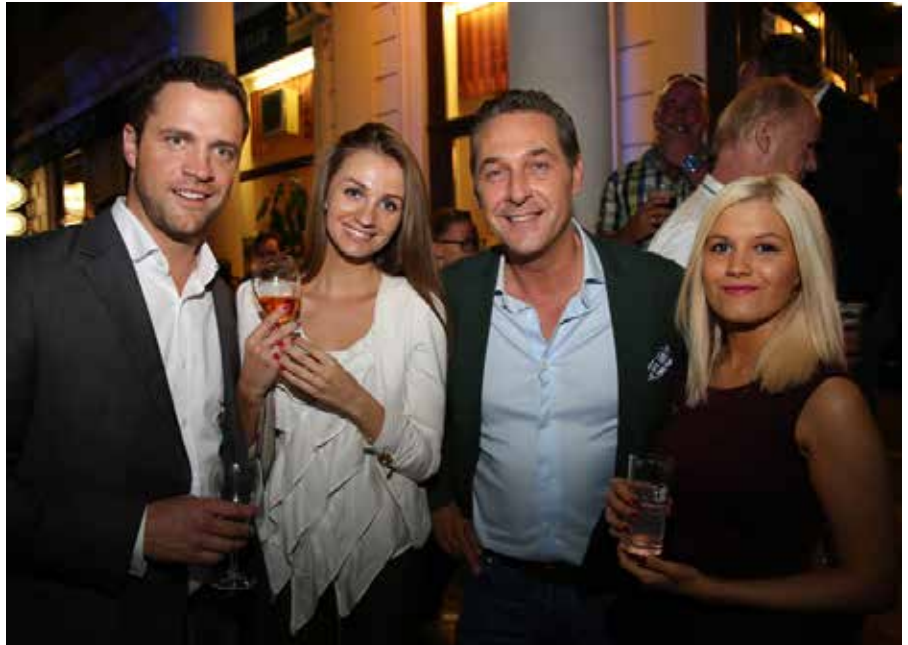
Strache und Gudenus bei einer Wahlparty der FPÖ 2014