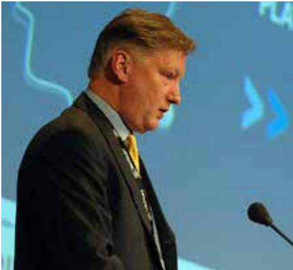
Als eine Art „Führungsoffizier“ der deutschen Zelle der „Integrity Initiative“ fungiert der geleakten Papieren zufolge der Brite Harold Elletson, der laut der britischen Zeitung „Observer“ früher als Agent des britischen Auslandsgeheimdienstes MI6 in Osteuropa und auf dem Balkan tätig war. (Foto: Online Educa Berlin 2007 - Opening Plenary, November 29, 2007, Harold Elletson

wenn ihre eigenen Medien, „Komiker“ und „Künstlergruppen“ kurz vor der EU-Wahl einen solchen Coup vorbereiten. Ehemalige BND-Chefs zeigten sich in den Medien gleichwohl überrascht [28] und verwiesen stattdessen auf den Mossad, allerdings ohne dies zu belegen [29].