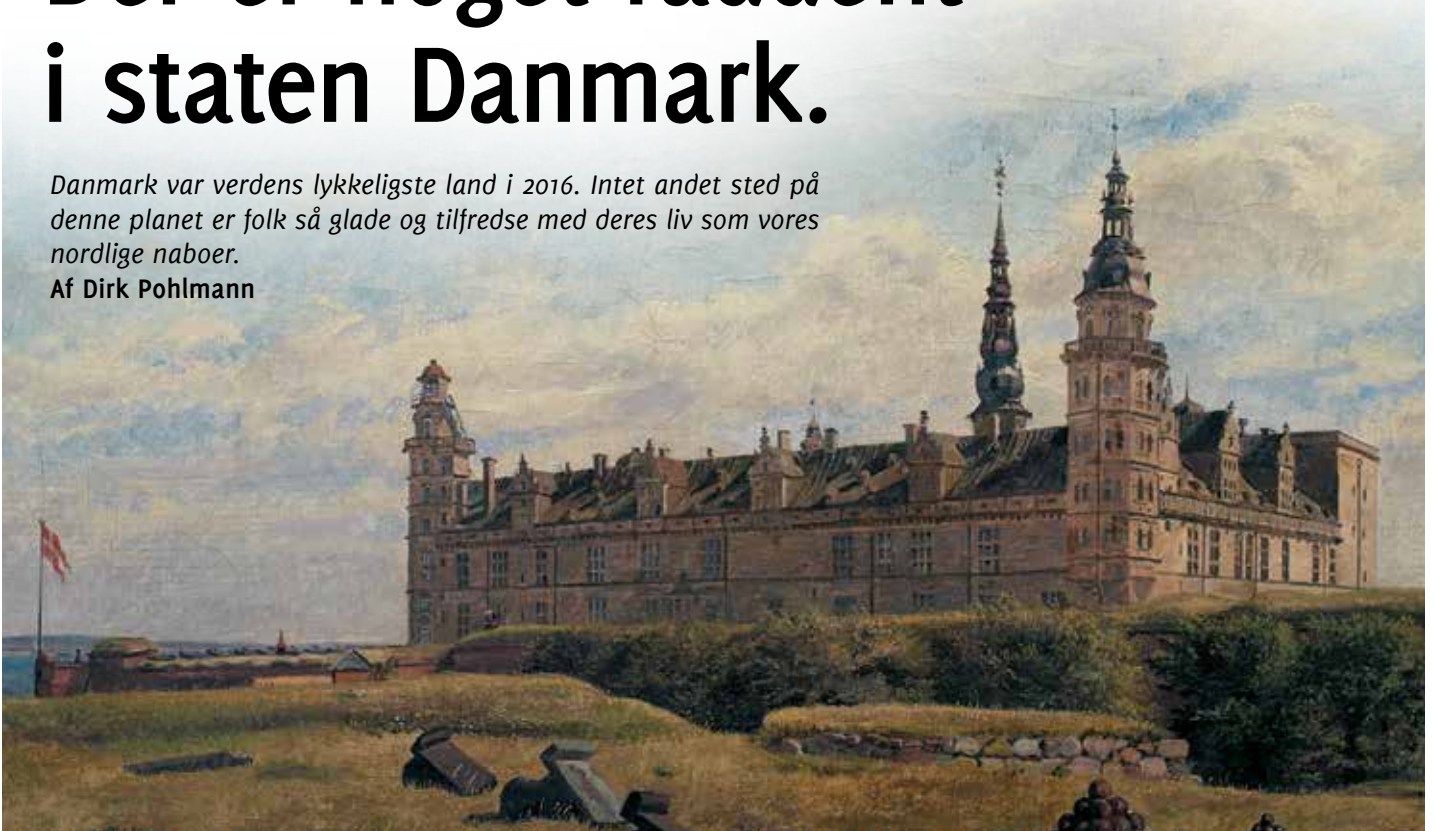
Foto: Constantin Hansen, Slottet Kronborg, 1834, Statens Museum for Kunst.