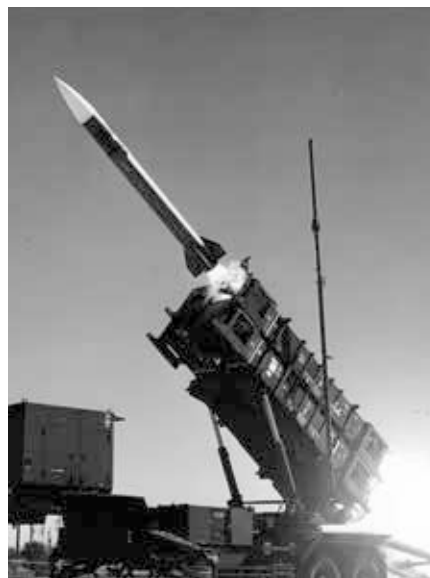
Rakete vom Typ w:de:MIM-104 Patriot.. Quelle: https://en.m.wikipedia.org/wiki/File:Patriot_missile_launch_b.jpg , Foto: Wikipedia / U.S. Army, Lizenz: Public Domain

So fand beispielsweise das Center for Studies in Communication der Universität von Massachusetts heraus, dass die Menschen umso weniger über die Hintergründe des Golfkrieges von 1991 wussten, je häufiger sie während der Krise vor dem Fernseher gesessen hatten, und dass sie auch den Krieg umso entschiedener bejahten. Bei der Frage nach Grundkenntnissen über die Region, die Politik der USA und die Ereignisse, die zu diesem Krieg geführt hatten, stellte das Forscherteam fest, dass „die auffälligsten Wissenslücken bei den Menschen solche Informationen