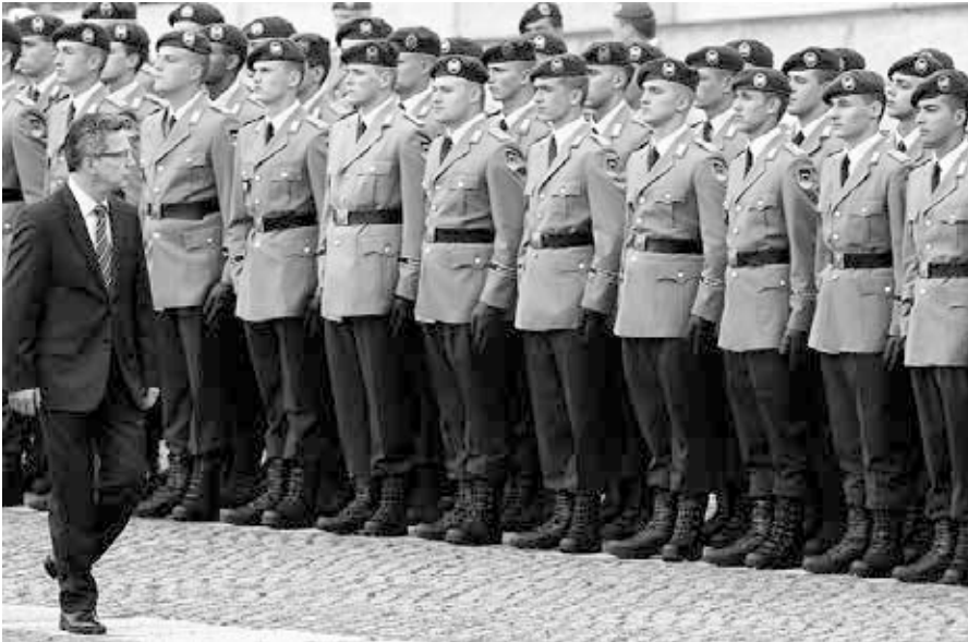
Bundesverteidigungsminister Thomas de Mezieres inspiziert die Ausbildung der Rekruten der Bundeswehr. Quelle: https://de.wikipedia.org/wiki/Datei:Новобранцы_Бундесвера.jpg , Foto: Wikipedia / Wolfgang Kumm, Lizenz: CC BY-SA 4.0

spielsweise den Erscheinungen der Mode – mittels einer als ritualisierte Praxis angelegten visuellen Repräsentation Einfluss auf die gesellschaftliche Symbolik zu nehmen vermögen, die zuvor diagnostizierten Kerndimensionen also vereinen.