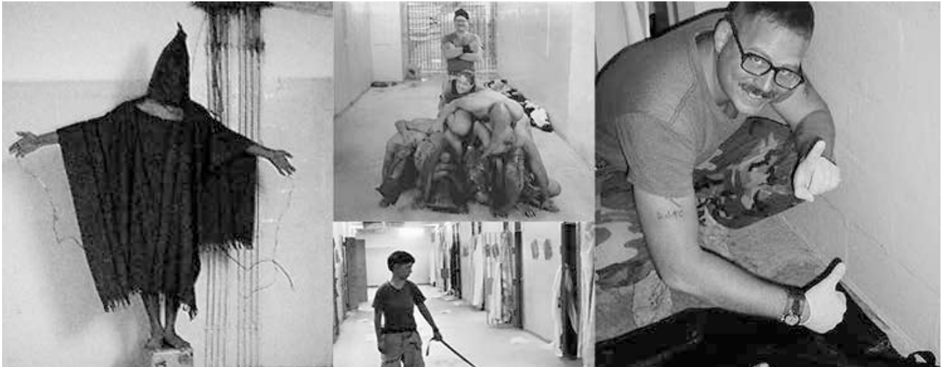
Bilder, die als Mahnmal der Schande um die Welt gingen und doch nur die Spitze des Eisbergs waren: Der Abu-Ghraib-Folterskandal.