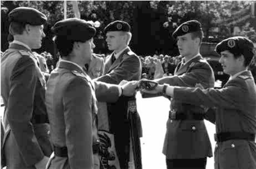
Das RekrutInnengelöbnis in der „Öffentlichkeit“ (50). Eine Abordnung der Rekruten tritt vor und spricht den Gelöbnistext mit einer Hand an der Flagge: „Ich gelobe, der Bundesrepublik Deutschland treu zu dienen und das Recht und die Freiheit des deutschen Volkes tapfer zu verteidigen.“ Im Hintergrund stehen zivile Angehörige und ausgewählte Waffensysteme. Quelle: https://www.rubikon.news/artikel/der-krieg-um-unsere-kopfe , Foto: Rubicon, Lizenz: CC-BY-NC-ND 4.0

Heute, nachdem auch für die Bundeswehr eine Präventivkriegsdoktrin in den verteidigungspolitischen Richtlinien zugrunde gelegt worden ist – wenn auch in verklausulierter Form als im US-amerikanischen Vorbild [40] –, ist Kriegführung als Mittel der Politik auch in Deutschland wieder selbstverständlich. Mehr noch: Sie findet entgegen der philanthropisch-staatspazifistischen Rhetorik auch kontinuierlich statt, während es gleichzeitig gelingt, bundesweite Demonstrationen als Unterstützung von Regierungspolitik zu interpretieren.