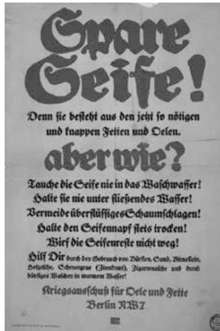
Deutsches Plakat ruft während des Ersten Weltkrieges zur Einsparung von Seife durch die Bevölkerung auf. (Plakat: Lucian Bernhard, artist, 1883–1972, gemeinfrei)

In Wirklichkeit erleben wir ein massives Artensterben [1], wie es die Welt seit dem Ende der Dinosaurier vor 65 Millionen Jahren nicht mehr gesehen hat, wobei jeden Tag etwa 200 Arten aussterben [2]. Das gesamte, uns umgebende Ökosystem, aus dem wir hervorgegangen sind, verschwindet vor unseren Augen. Mehr als die Hälfte der weltweiten Tierwelt [3] ist in den letzten 40 Jahren verschwunden, und die weltweite Insektenpopulation ist um bis zu 90% zurückgegangen [4]. Fruchtbare Böden verschwinden [5], ebenso wie Wälder [6]. Die Ozeane ersticken [7], 90% der weltweiten Fischbestände sind entweder vollständig leer gefischt oder überfischt [8], die Meere sind voll von Mikroplastik [9], und Phytoplankton, eine unverzichtbare Grundlage der Nahrungskette der Erde, wurde seit 1950 zu 40 Prozent vernichtet [10]. Die Wissenschaft hat immer wieder gezeigt [11], dass die globale Erwärmung schneller stattfindet als vorhergesagt [12], und es gibt selbstverstärkende Erwärmungseffekte [13], die