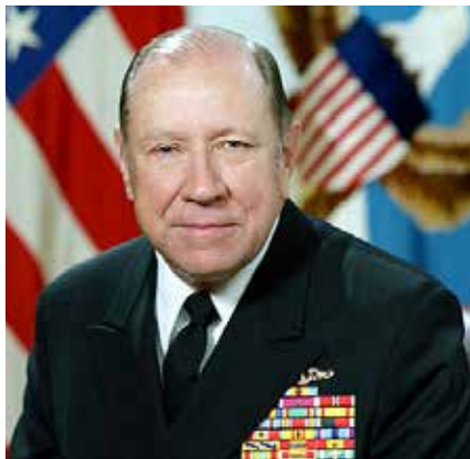
U.S. Navy ADM William J. Crowe Jr., former Chairman of the Joint Chiefs of Staff. 10. Oktober 1985

Herrhausen wollte der UdSSR zu einer funktionierenden Wirtschaft verhelfen, sich als guter Nachbar erweisen, ein Europa unter Einschluss der UdSSR gestalten. Herrhausen riet zu einer langsamen Vorgehensweise, sprach davon, dass es ein oder zwei Generationen brauchen werde, bis die UdSSR so weit sein würde. Man solle mit konkreten Joint Ventures beginnen, Manager ausbilden, Unternehmer ausbilden. Herrhausen wollte keine Schocktherapie. Er sah Deutschland in einer Führungsrolle, aber nicht im Sinne eines Diktators, nicht im Sinne eines Vierten Reiches. Wie so viele andere, wie die meisten, glaubte er, dass das möglich sei. Er sah die Möglichkeiten, er wollte sie gestalten. „Macht muss man auch wollen“ war ein weiteres Zitat von ihm.