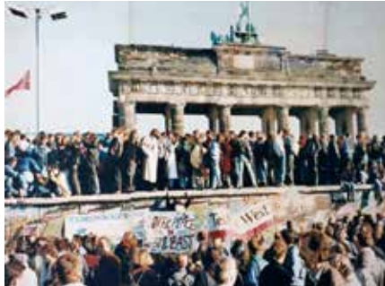
Der Fall der Berliner Mauer, 1989. Das Foto zeigt einen Teil einer öffentlichen Fotodokumentation am Brandenburger Tor, Berlin. Die Fotodokumentation, präsentiert vom Senat von Berlin, ist dauerhaft der Öffentlichkeit zugänglich und fällt daher unter §59 UrhG.

führung (PsyOps und PolWar genannt), auch gegen Alliierte als wesentliche Elemente in das politische Arsenal eingefügt – und gesiegt.