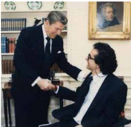
Kolumnist Charles Krauthammer trifft President Ronald Reagan 1986 im Weißen Haus.