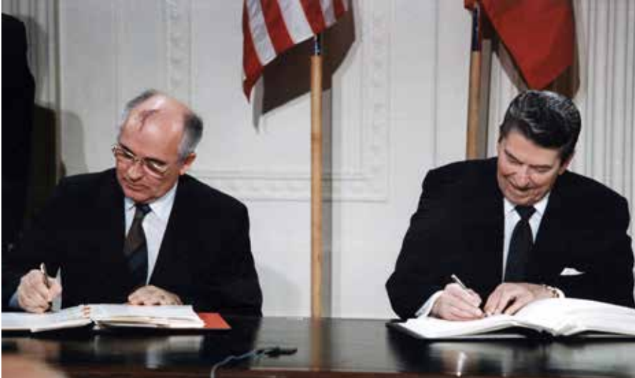
US-Präsident Reagan (rechts) und der sowjetische Generalsekretär Gorbatschow (links) unterzeichnen den INF-Vertrag im Weißen Haus am 8. Dezember 1987.

Offenbar hatte Bush Senior erstaunliche Fähigkeiten als Wahrsager. Während deutsche Politiker heute noch darüber berichten, wie die Realität sich ständig schneller veränderte als die Planung, die sie gestalten sollte, während Helmut Kohl noch im Oktober 1989 von einer Föderation zweier deutscher Staaten ausging, ahnte der US-Präsident also bereits zur Jahreswende 1988/1989, dass es in Deutschland „ums Ganze“ gehen würde.