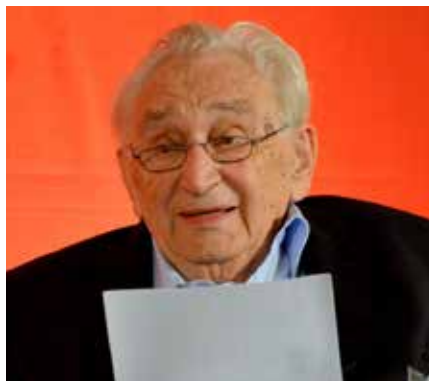
Egon Bahr, Berater Brandts in Ost- und Deutschlandpolitik, SPD, Journalist, beim außerordentlichen Parteitag der SPD, 1978.

Gorbatschow spricht bis heute vom „Gemeinsamen Haus Europa“. Es gab gerade im blutgetränkten Kontinent Europa viele Politiker, aber auch Militärs, die Gor-