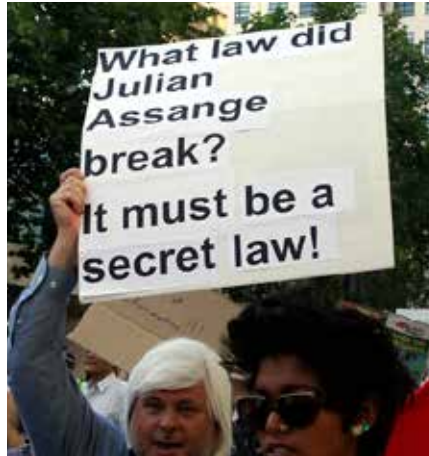
Proteste gegen die Freiheitsberaubung von Julian Assange

Zweck der gestrigen Anhörung war die Fallbearbeitung, um den Zeitplan für das Auslieferungsverfahren festzulegen. Die Kernpunkte, um die es ging, waren, dass Julians Verteidigung mehr Zeit für die Vorbereitung ihrer Beweise forderte; und das Argument, dass politische Straftaten ausdrücklich vom Auslieferungsvertrag ausgeschlossen sind. Es sollte daher eine