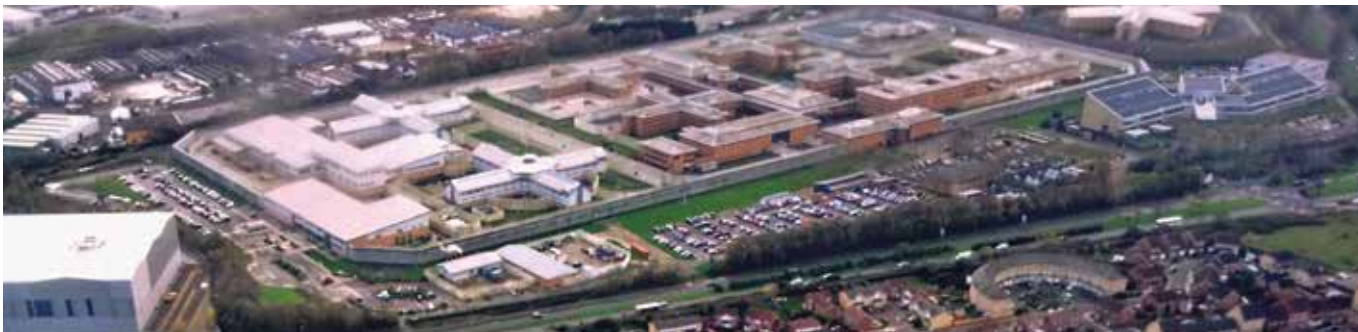
Luftbild von HM Prisons Isis und Belmarsh in Thamesmead, Südost-London.

worden sind. Der Umzug nach Belmarsh könnte eine amerikanische Initiative sein.