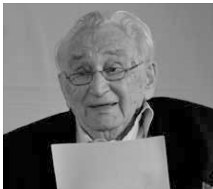
Egon Bahr, Berater Brandts in Ost- und Deutschlandpolitik, SPD, Journalist, beim außerordentlichen Parteitag der SPD, 1978.

Gorbatschow spricht bis heute vom „Gemeinsamen Haus Europa“. Es gab gerade im blutgetränkten Kontinent Europa viele Politiker, aber auch Militärs, die Gor-