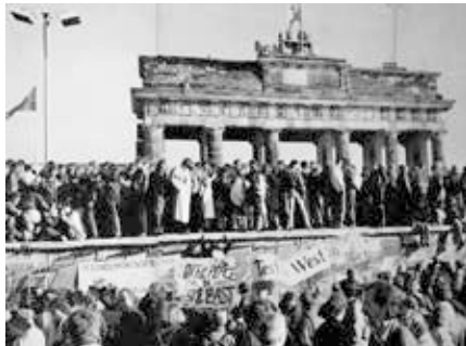
Der Fall der Berliner Mauer, 1989. Das Foto zeigt einen Teil einer öffentlichen Fotodokumentation am Brandenburger Tor, Berlin. Die Fotodokumentation, präsentiert vom Senat von Berlin, ist dauerhaft der Öffentlichkeit zugänglich und fällt daher unter §59 UrhG.

führung (PsyOps und PolWar genannt), auch gegen Alliierte als wesentliche Elemente in das politische Arsenal eingefügt – und gesiegt.