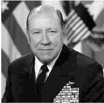
U.S. Navy ADM William J. Crowe Jr., former Chairman of the Joint Chiefs of Staff. 10. Oktober 1985

Herrhausen wollte der UdSSR zu einer funktionierenden Wirtschaft verhelfen, sich als guter Nachbar erweisen, ein Europa unter Einschluss der UdSSR gestalten. Herrhausen riet zu einer langsamen Vorgehensweise, sprach davon, dass es ein oder zwei Generationen brauchen werde, bis die UdSSR so weit sein würde. Man solle mit konkreten Joint Ventures beginnen, Manager ausbilden, Unternehmer ausbilden. Herrhausen wollte keine Schocktherapie. Er sah Deutschland in einer Führungsrolle, aber nicht im Sinne eines Diktators, nicht im Sinne eines Vierten Reiches. Wie so viele andere, wie die meisten, glaubte er, dass das möglich sei. Er sah die Möglichkeiten, er wollte sie gestalten. „Macht muss man auch wollen“ war ein weiteres Zitat von ihm.