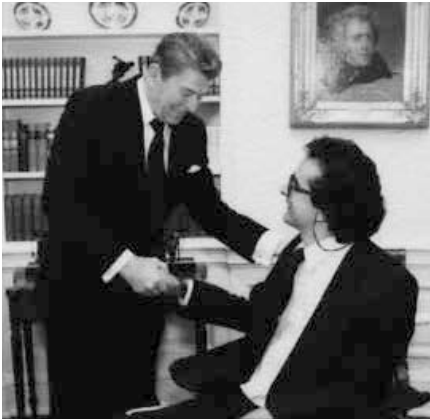
Kolumnist Charles Krauthammer trifft President Ronald Reagan 1986 im Weißen Haus.