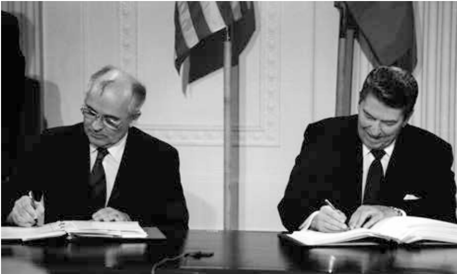
US-Präsident Reagan (rechts) und der sowjetische Generalsekretär Gorbatschow (links) unterzeichnen den INF-Vertrag im Weißen Haus am 8. Dezember 1987.

Offenbar hatte Bush Senior erstaunliche Fähigkeiten als Wahrsager. Während deutsche Politiker heute noch darüber berichten, wie die Realität sich ständig schneller veränderte als die Planung, die sie gestalten sollte, während Helmut Kohl noch im Oktober 1989 von einer Föderation zweier deutscher Staaten ausging, ahnte der US-Präsident also bereits zur Jahreswende 1988/1989, dass es in Deutschland „ums Ganze“ gehen würde.