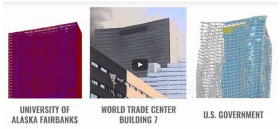
Bild 1: Das Computermodell der Hulsey-Studie (Bild links) stimmt mit dem realen Einsturz von WTC7 überein (Bild Mitte). Das Computermodell der US-Regierung (Bild rechts) jedoch nicht. Dies zeigt: Die US-Regierung hat nicht ehrlich über den Einsturz von WTC7 informiert.

Schon seit einigen Jahren wird über den Einsturz von WTC7 diskutiert. In England sorgte damals Reporterin Jane Stanley von BBC, die am Tag der Anschläge live aus New York über den Einsturz von WTC7 berichtete, für Verwirrung. Sie berichtete am 11. September 20 Minuten zu früh über den Einsturz von WTC7, das