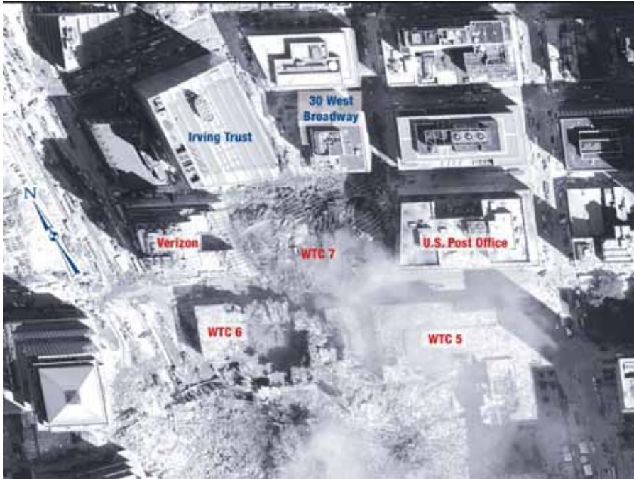
Luftaufnahme vom September 2001 von Trümmern, die durch den Einsturz von WTC 7 entstanden sind

Danach hat die US-Regierungsbehörde National Institute of Standards and Technology (NIST) in einem anderen Bericht, der am 21. August 2008 publiziert wurde, behauptet, WTC7 sei wegen Feuer eingestürzt. Der Hulsey-Bericht zeigt nun, dass dies nicht die Wahrheit ist. NIST-Untersuchungsleiter Shyam Sunder hatte damals erzählt, dass beim Einsturz des Nordturms WTC 1 um 10:28 Uhr Trümmerteile auf das 110 Meter entfernt gelegene WTC7 gefallen seien und dort Bürobrände ausgelöst hätten. Das war tatsächlich der Fall. Doch die Behauptung von Sunder, dass sich daraufhin der horizontale Stahlträger A2001 ausdehnte und von seiner Halterung an der Säule 79 sprang, entspricht nicht der Wahrheit (6).