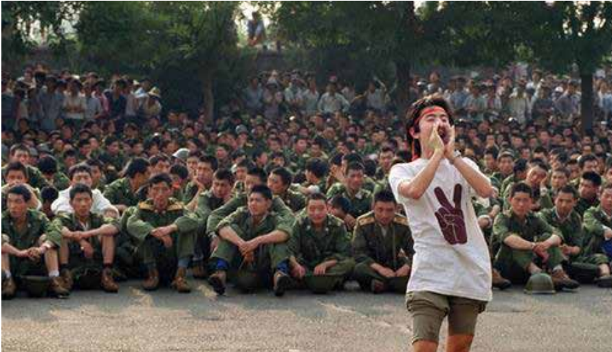
(b1). 3. Juni 1989: Ein Demonstrant fordert die Soldaten auf, sich zurückzuziehen.

derswo Einmischung forder[te]n. Sie vertraten und vertreten Agenden – bewusst oder unbewusst –, die ihnen indoktriniert wurden. An den Ereignissen im China des Jahres 1989 möchte ich das belegen.