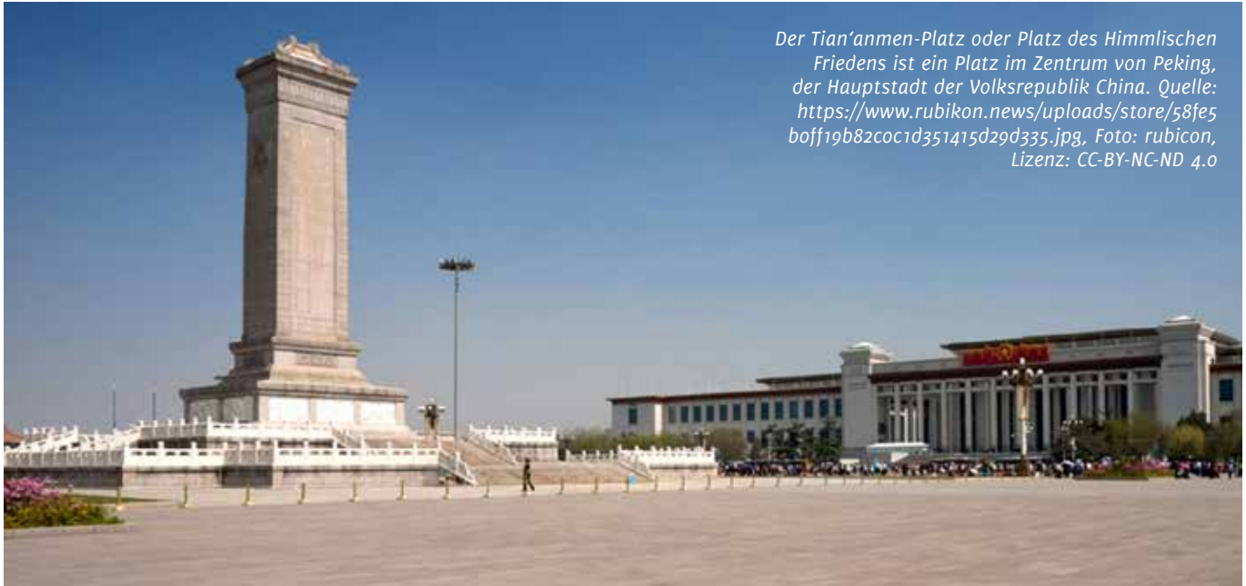
Der Tian'anmen-Platz oder Platz des Himmlischen Friedens ist ein Platz im Zentrum von Peking, der Hauptstadt der Volksrepublik China. Quelle: https://www.rubikon.news/uploads/store/58fe5boff19b82c0c1d351415d29d335.jpg , Foto: rubicon, Lizenz: CC-BY-NC-ND 4.0