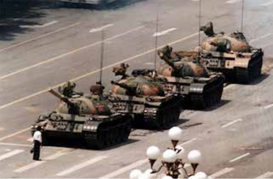
(b6). Tank-Man“ in Peking 1989. Quelle: https://www.rubikon.news/media/images/882014e1aabdee93b457e51ef94999f4.jpg , Foto: rubiconn, Lizenz: CC-BY-NC-ND 4.0

Sonderbotschafter für Venezuela – sitzt bis heute im Direktorat des NED; neben ihm eine Reihe von Kongressabgeordneten, Senatoren und führenden Mitgliedern weiterer Stiftungen [43, 44].