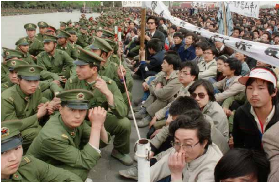
(b3). Polizisten und Demonstranten auf dem Tiananmen-Platz. Quelle: https://www.rubikon.news/media/images/f99f18655f540b3ff75b7cfd369b8b30.png , Foto: rubicon, Lizenz: CC-BY-NC-ND 4.0

Am 30. April 1975 wurde mit der Eroberung Saigons durch die nordvietnamesische Armee der 30-jährige Krieg des Westens gegen Vietnam faktisch beendet [19]. Allerdings wurde er umgehend durch einen verdeckten Krieg ersetzt. Keine zwei Wochen zuvor übernahmen nämlich die Roten Khmer die Macht in Kambodscha [20]. Schnell wurde bekannt, dass sie – unter anderem mit tausenden Kindersoldaten – in Phnom Penh einmarschiert waren [21]. Innerhalb eines Jahres etablierten sie eine Schreckensherrschaft mit hunderttausenden Toten. Ihr Gewalt-Regime hatte nur mit der Unterstützung des maoistischen Chinas entstehen können, was die westlichen Massenmedien auch korrekt wiedergeben [22]. Worüber diese Medien schweigen, verbinde ich mit der Frage: Wer unterstützte die Pol Pot – Diktatur noch?