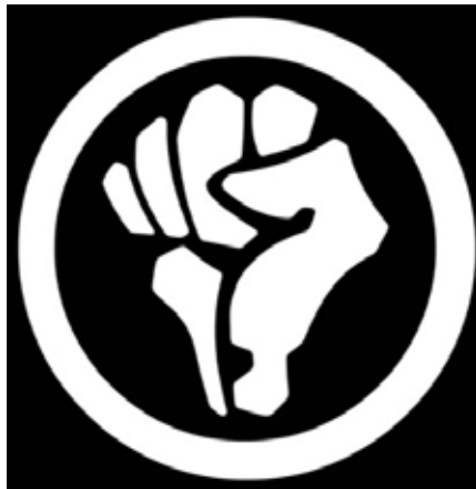
(b2). Otpor-Symbol. Quelle: https://www.rubikon.news/media/images/e3d2dedd-1f26b8cf9949330b7993ca59.png , Foto: rubicon, Lizenz: CC-BY-NC-ND 4.0

Mit Maos Tod wurde in den Machtspitzen die Frage, wie das Land seinen weiteren Weg bestreiten würde, neu aufgerollt. Grob gesagt, konkurrierten zwei Konzepte. Auf der einen Seite bestand die Shanghai-Gruppe um die Witwe Maos – später als Viererbande verhaftet und verurteilt – auf der Fortführung des „Langen Marsches“. Hier versammelten sich unter anderem die Aktivisten der 1966 be-