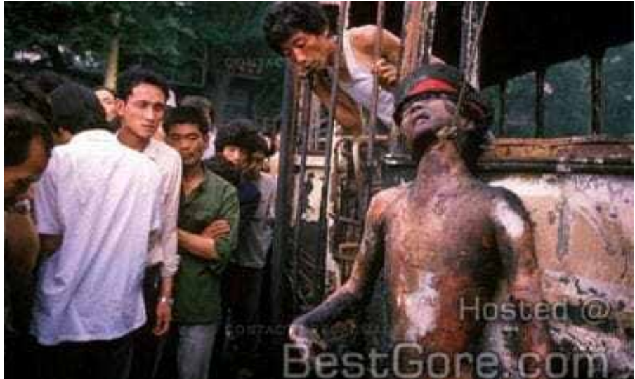
(b7). Gelynchter Soldat der Chinesischen Volksbefreiungsarmee im Juni 1989. Quelle: https://www.rubikon.news/media/images/964101732587811bb7ec1b8eae628c6c.jpg.

Der einzige Besuch des früheren CIA-Direktors und nunmehrigen US-Präsidenten George Bush fand im Februar 1989 – wenige Monate vor den studentischen Protesten – statt. Er beinhaltete ein zweistündiges Gespräch mit Zhao Ziyang. Zusätzlich nahm der US-Botschafter in Chi-