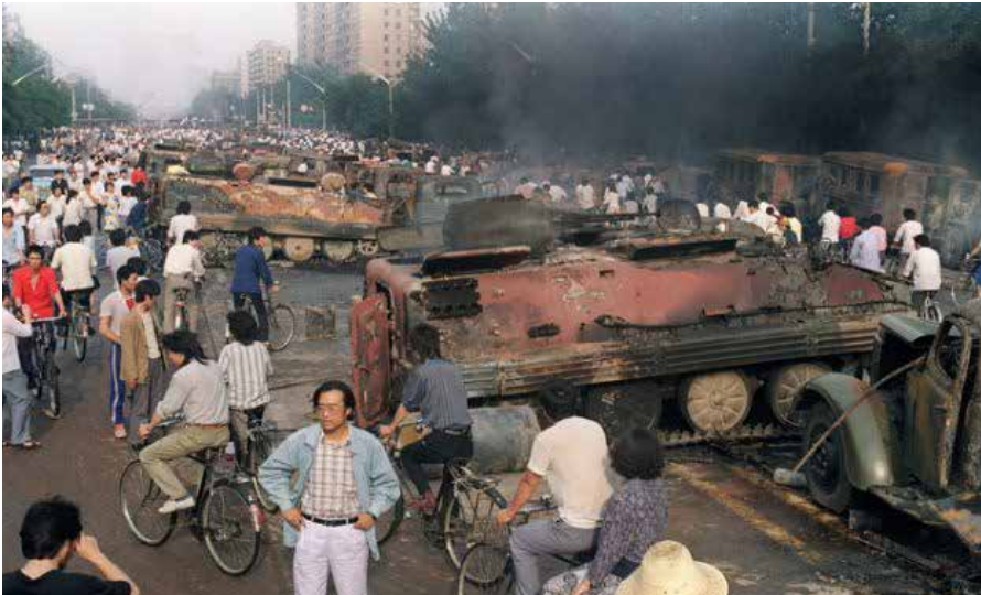
(b6) Ausgebrannte gepanzerte Fahrzeuge der Chinesischen Volksbefreiungsarmee in Peking während der Ereignisse am Tiananmen-Platz. Quelle: https://www.rubikon.news/media/images/069a20f3c445dbc8e2b3a4967513f4c5.jpg , Foto: rubicon, Lizenz: CC-BY-NC-ND 4.0

diese Diszipliniertheit und Methodik der Proteste auf dem Tiananmen-Platz? Einseitigkeit in der Berichterstattung ist ein Wesensmerkmal von Propaganda. Das gilt auch für Berichte über Gewalt. Bildmaterial vom „Massaker auf dem Tiananmen-Platz“ ist nicht auffindbar. Das ist nachvollziehbar, weil dieses Massaker eine Erfindung ist und wir müssen uns fragen, warum man solch ein Narrativ in die Welt setzte. Bilder von außerhalb des Platzes waren dagegen verfügbar und mir scheint, dort griffen die Konzepte der Albert Einstein Institution nicht so recht – aber vielleicht andere [b6]: Molotov-Cocktails herzustellen und anzuwenden, beinhaltet Vorsatz und geplantes operatives Vorgehen. Es brannten nicht nur Panzerfahrzeuge der chinesischen Armee, sondern auch Soldaten [b7]: Das war keine Einzelerscheinung. Regierungsangaben sprechen von 300 toten Menschen, unter denen mehrere Dutzend Angehörige der VBA zu zählen sind. Gern darf ein kritischer Leser diese Zahlen hinterfragen und prüfen. Doch die pure Tatsache, dass eine nicht näher genannte Zahl chinesischer Soldaten auf bestialische Weise von „friedlichen Demonstranten“ zu Tode gequält wurden, muss benannt werden, um die Ereignisse um den Tiananmen-Platz differenziert, statt durch die Schwarz-Weiß-Brille betrachten zu können [71, 72].