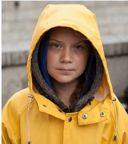
Greta Thunberg

Mark Carney von der Bank of England war auch eine Schlüsselfigur bei den Bemühungen, die City of London zum globalen Zentrum von Green Finance zu machen. Der scheidende britische Finanzminister Philip Hammond hat im Juli 2019 ein Weißbuch herausgegeben: „Grüne Finanzstrategie: Die Transformation der Finanzen hinzu einer Grünen Zukunft“. In dem Papier heißt es: „Eine der einflussreichsten Initiativen dabei ist die Private Task Force on Climate-related Financial Disclosure (TCFD) des Financial Stability Board, unterstützt von Mark Carney