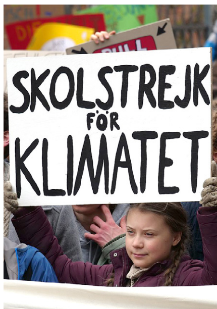
Greta Thunberg am Fronttransparent der FridaysForFuture Demonstration am 29. März 2019 in Berlin.

Ohne dieses „Reset“ bleibt auch eingespartes CO2 nur heiße Luft.