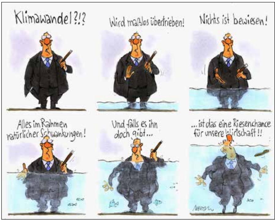
Karikatur von Gerhard Mester zum Thema Klimawandel gibt es nicht (Abb. Gerhard Mester, wikimedia, CC BY-SA 4.0)

Dieser Text wurde zuerst am 30.08.2019 auf www.kenfm.de unter der URL < https://kenfm.de/tagesdo-sis-30-8-2019-klimabetrug-gerichtsurteil-stuerzt-co2-papst-vom-thron/ > veröffentlicht. Lizenz: Rainer Rupp, KenFM, alle Rechte vorbehalten