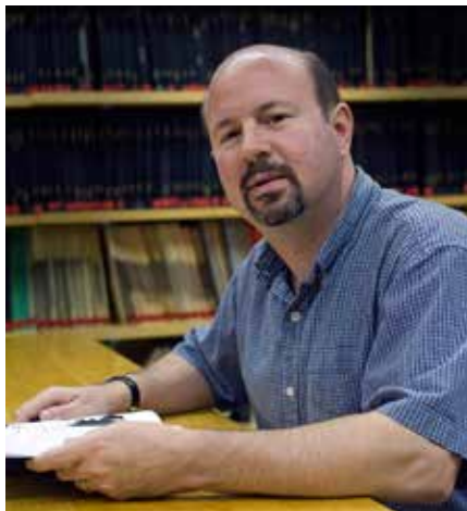
Michael E. Mann ist ein US-amerikanischer Klimatologe mit dem Forschungsschwerpunkt Paläoklimatologie.