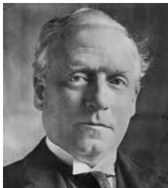
Herbert Henry Asquith (1852-1928)

Brug kontaktformularen på www.free21DK.org