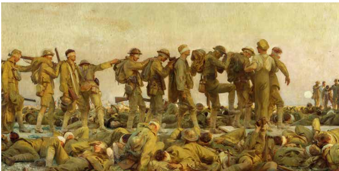
"Gassed", John Singer Sargent (1856-1925).