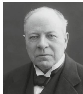
Richard Haldane (1856-1928)

ne, der havde ansporet fjendtlighederne. Teorien var, at Tyskland - i et forsøg på at antænde konflikter mellem Rusland og England, som for nylig havde indgået en alliance med japanerne, - havde pustet til krigsflammerne mellem Rusland og Japan. Sandheden var selvfølgelig næsten præcis det modsatte. Lord Lansdowne havde ført hemmelige forhandlinger med Japan, inden han underskrev en formel traktat i januar 1902. Da Japan havde opbrugt sine reserver på at opbygge militæret, vendte Japan sig til Cecil Rhodes' medsammensvorne, Lord Nathan Rothschild, for at få selve krigen finansieret [11]. Ved at afskære den russiske flådes adgang til Suezkanalen og høj kvalitets-kul, som de leverede til japanerne, gjorde briterne alt, hvad de kunne for at sikre, at japanerne ville knuse den russiske flåde og effektivt fjerne deres største europæiske konkurrent til Fjernøsten. Den japanske flåde blev endda bygget i Storbritannien [12], men disse fakta fandt ikke vej til pressen, der var kontrolleret af Milner.