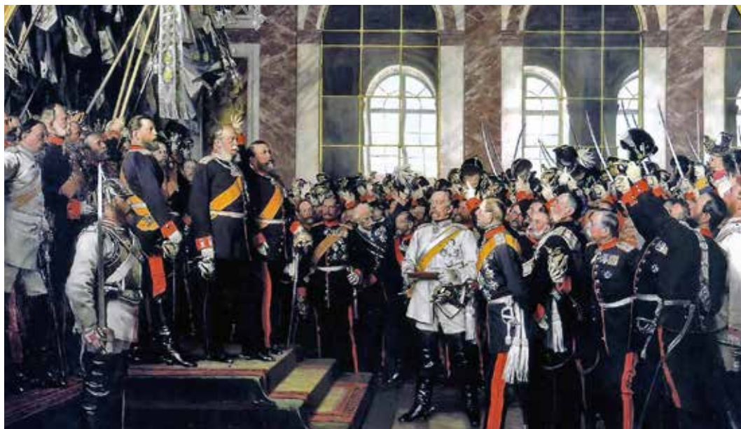
”The proclamation of the German Empire”, Anton von Werner (1843-1915).

Men i modsætning til dette stilfærdige offentlige image var gruppen lige fra begyndelsen primært interesseret i krig. Faktisk var et af de første skridt, der blev taget af dette ”Rhodes Round Table” (som det også var kendt som) at manøvrere det britiske imperie ud i en krig i Sydafrika. Boerkrigen fra 1899-1902 skulle tjene et dobbelt formål: Den skulle forene Sydafrikas forskellige republikker og kolonier i en enkelt enhed under kejserlig, britisk kontrol og - ikke