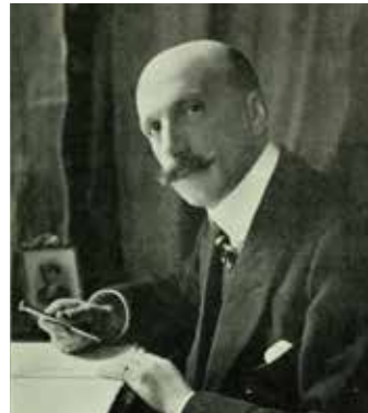
Reginald Brett, senere Lord Esher (1852-1930) historiker og politiker.