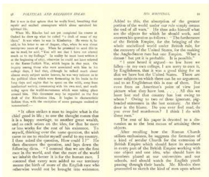
”The Last Will And Testament Of Cecil Rhodes”, side 58-59.

Tyskland. I 1871 forenede de tidligere adskilte stater i det mo-