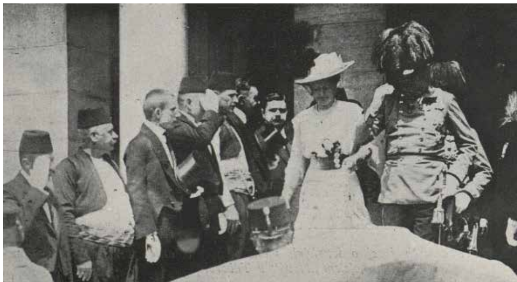
Den østrigske tronfølger, ærkehertug Franz Ferdinand (1863-1914) og hustru Sophie Chotek, hertuginde af Hohenberg (1868-1914) på trappen til rådhuset i Sarajevo kort før de blev myrdet, 28.06.1914.