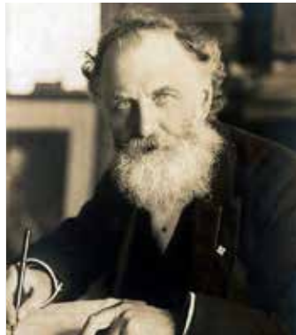
William Thomas Stead (1849-1912) redaktør "The Pall Mall Gazette".