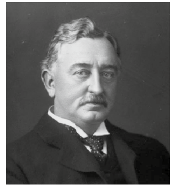
Cecil Rhodes (1853-1902) politiker og diamantmagnat.