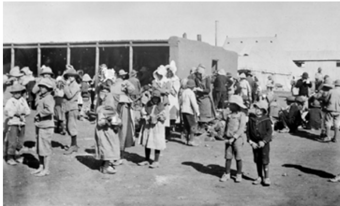
Boer kvinder og børn i Britisk koncentrationslejr.

"Ja, set fra det britiske perspektiv blev Tyskland, efter dets forening i 1871, meget hurtigt meget