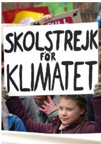
Greta Thunberg am Fronttransparent der FridaysForFuture Demonstration am 29. März 2019 in Berlin.

Ohne dieses „Reset“ bleibt auch eingespartes CO2 nur heiße Luft.