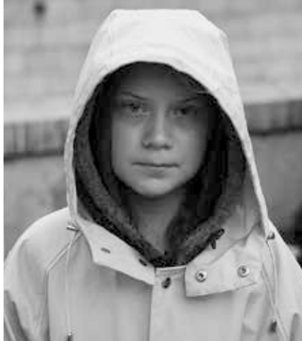
Greta Thunberg

Mark Carney von der Bank of England war auch eine Schlüsselfigur bei den Bemühungen, die City of London zum globalen Zentrum von Green Finance zu machen. Der scheidende britische Finanzminister Philip Hammond hat im Juli 2019 ein Weißbuch herausgegeben: „Grüne Finanzstrategie: Die Transformation der Finanzen hinzu einer Grünen Zukunft“. In dem Papier heißt es: „Eine der einflussreichsten Initiativen dabei ist die Private Task Force on Climate-related Financial Disclosure (TCFD) des Financial Stability Board, unterstützt von Mark Carney