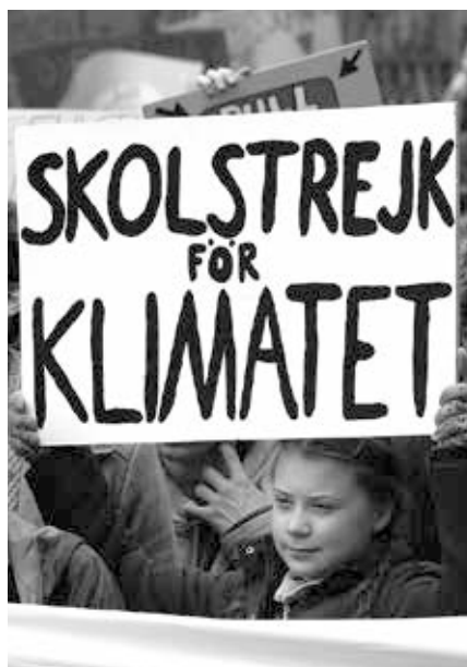
Greta Thunberg am Fronttransparent der FridaysForFuture Demonstration am 29. März 2019 in Berlin.

Ohne dieses „Reset“ bleibt auch eingespartes CO2 nur heiße Luft.