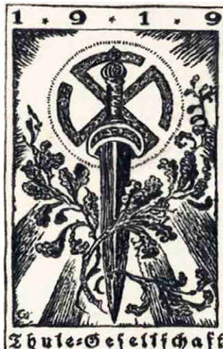
Thuleselskabet's emblem.

Thuleselskabet blev formelt opløst i 1925, hvor det havde omkring 2.500 medlemmer, hovedsageligt fremtrædende nazister. I ledelsen