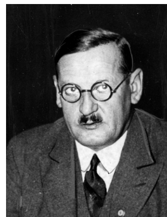
Anton Drexler (1884-1942). Låsesmed. Grundlægger af det tyske arbejderparti.