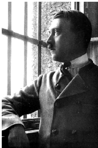
Adolf Hitler (1889-?). Hitler skrev „Mein Kampf” under det korte fængselsophold i Landsberg.

I de kommende år opstod der talrige mindre militante grupper i München, som alle ønskede at skabe et socialistisk eller nationalistisk diktatur i Bayern, og i september 1923 blev der dannet et fællesforbund for disse grupper – med Adolf Hitler i spidsen. Herefter fulgte i november 1923 Hitlers mislykkede kupforsøg, som endte med en dom på fem års fængsel til Hitler. Han afsonede dog kun ni måneder, før han efter pres fra nazipartiet blev løsladt, og i denne periode skrev han ”Mein Kampf”[4], – et værk, som fundamentalt bygger på Thuleselskabets ideologi om racer og verdensherredømme.