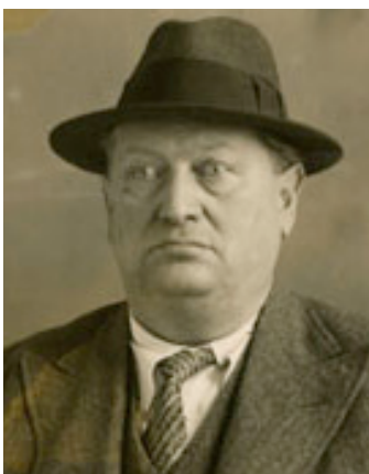
Rudolf von Sebottendorff (1875-1945). Frimurer, okkultist og grundlægger af Thuleselskabet.

hjelme med hagekors. Revolutionen lykkedes, den bayerske sovjetrepublik var for en stund en realitet, og fra det stærkt højreorienterede miljø i München begyndte man nu at forme det netværk af Thule-medlemmer, som skulle præge landet i de kommende år.