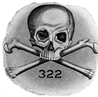
Skull and Bones logo.

sad mange prominente medlemmer fra The Bavarian Illuminati; den bayerske frimurerloge, hvorfra i øvrigt talrige medlemmer efter 2. verdenskrig blev indsluset til USA under Operation Paperclip[6] og optaget i amerikanske frimurerloger, hovedsageligt Skull & Bones[6]. Dette er som bekendt samme loge, som bl.a. Bush-familien[7] dengang frekventerede og fortsat er medlem af.