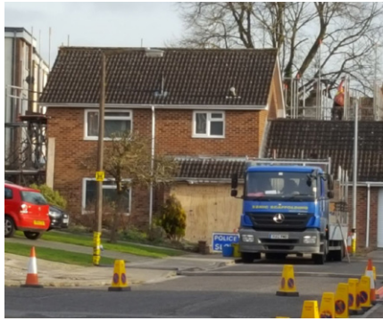
Das Skripal-Haus, dessen Haustürklinke mit Novichok besprüht gewesen sein soll, so dass die Skripals dadurch vergiftet wurden. Unklar ist weiterhin, wie es den Attentätern gelang, dass beide Skripals beim Verlassen des Hauses die äußere Klinke berührten und wieso diese trotz des hochtoxischen Giftes erst Stunden später zusammenbrachen. Das Dach des Hauses wurde inzwischen ersetzt.

Er lernte dieses interessante Zeug bald kennen, als er nach Salisbury geschickt