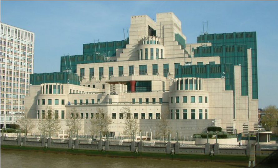
Die Aktivitäten des britischen SIS (Secret Intelligence Service), zu dem das im Falle Skripal aktive MI6 gehört, sind so legendär wie umstritten. Das SIS-Gebäude am Vauxhall Cross, London, von der Vauxhall Bridge aus gesehen.

ligen. Wenn der Westen nicht durch den Atomkrieg ausgelöscht wird, in den sie Russland ständig drängen, dann müssen Großbritannien und alle anderen NATO-Vasallenstaaten, die zu Unrecht Scharen russischer Diplomaten ausgewiesen haben, eines Tages Russland unterwürfig um Entschuldigung bitten und Entschädigung für das Elend zahlen, das dem russischen Volk durch ihre illegalen Sanktionen zugefügt wurde.