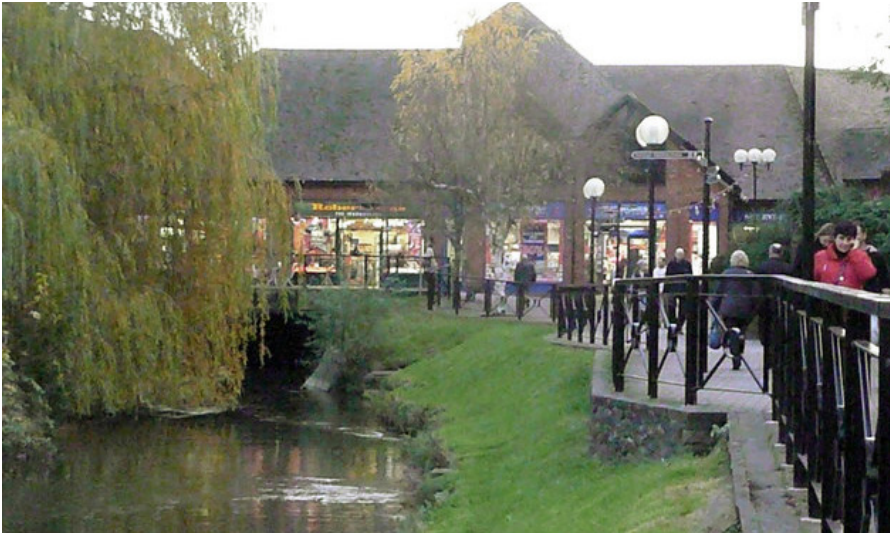
Das Einkaufszentrum in Salisbury, dessen außen installierte CCTV-Kameras entscheidende Hinweise zum Geschehen rund um den 4.3.2018 gegeben haben. Nicht alle Bilder dieser Kameras wurden bisher veröffentlicht. Die Bank, auf der die Skripals gefunden wurden, liegt in Sichtweite.

anders. Hysterischer Hass gegen Russland kann augenblicklich von den vom MI6 kontrollierten Medien und von den vom MI6 gehirngewaschenen Politikern entfacht werden. Jeder, der an der Schuld Russlands zweifelt, kann als Putin-Handlanger verunglimpft werden. Ob das Novichok per Kurier aus den USA geschickt oder in Porton Down produziert wurde, ist unwichtig. Entscheidend ist, dass der Versuch des MI6, die Skripals mit Novichok zu töten, katastrophal scheiterte.