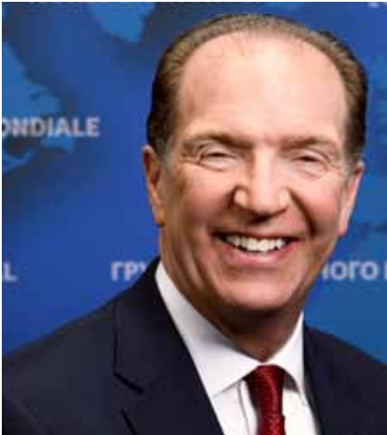
David Robert Malpass ist ein US-amerikanischer Ökonom und seit dem 9. April 2019 Präsident der Weltbank. Malpass ist seit 2017 als Staatssekretär für internationale Angelegenheiten im US-Finanzministerium tätig.

Nationen durch Verschuldung „gefangen zu nehmen“ und den verschuldeten Regierungen „strukturelle Anpassungsprogramme“ aufzuerlegen, welche zu einer Massenprivatisierung von Staatsvermögen, Deregulierung und Sparpolitik führen, wobei den ausländischen Unternehmen routinemäßig gegenüber der lokalen Wirtschaft Vorteile eingeräumt werden. Häufig verursachen diese Institutionen, indem sie die Länder zur Deregulierung ihres Finanzsektors drängen [10] und korrupte Geschäfte [11] mit staatlichen Akteuren machen, gerade die wirtschaftlichen Probleme, die sie dann nachher „beheben“ wollen.