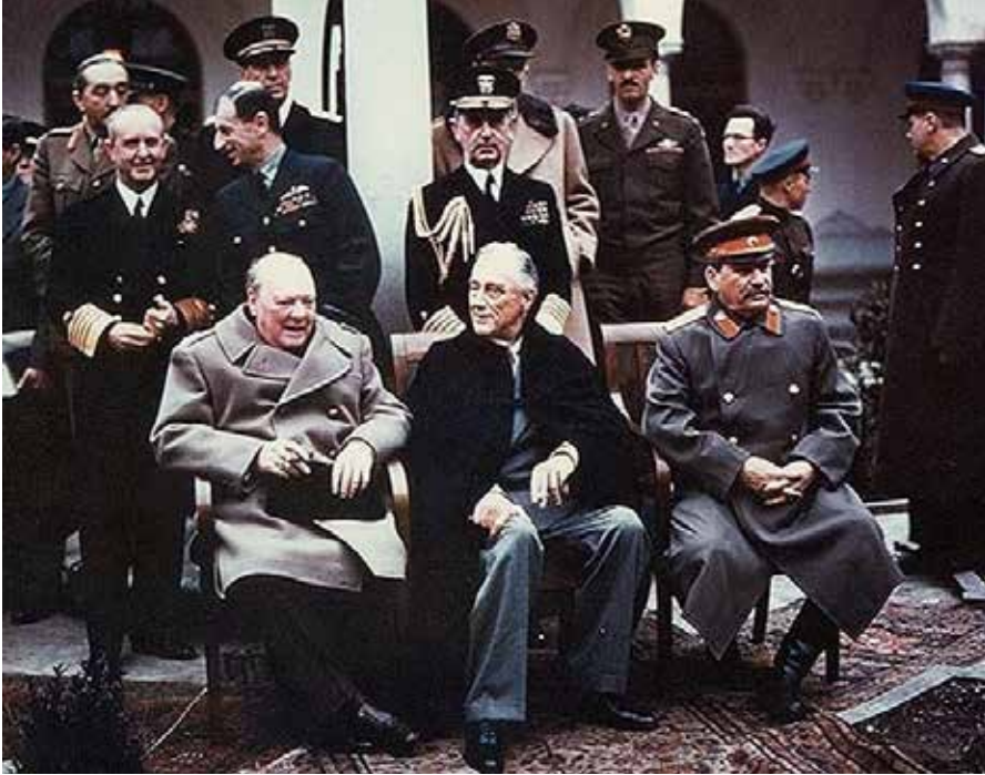
Die Konferenz von Jalta war ein diplomatisches Treffen der alliierten Staatschefs Franklin D. Roosevelt, Winston Churchill und Josef Stalin im auf der Krim gelegenen Badeort Jalta vom 4. bis zum 11. Februar 1945. . Quelle: https://de.wikipedia.org/wiki/Datei:Yalta_summit_1945_with_Churchill,_Roosevelt,_Stalin.jpg , Foto: Photograph from the Army Signal Corps Collection in the U.S. National Archives, Lizenz: public domain

Oliver und ich argumentierten, dass wenn Wallace Vizepräsident geblieben wäre, er am 12. April zum Präsidenten ernannt worden wäre und es im Zweiten Weltkrieg keinen Atombombenangriff und möglicherweise auch keinen Kalten Krieg gegeben hätte. Aber das ist eine andere Diskussion. Truman ist jetzt an der Macht. Alle Berater von Truman mit Ausnahme von Jimmy Byrnes drängen ihn, die Kapitulationsbedingungen zu ändern und die Japaner wissen zu lassen, dass sie ihren Kaiser behalten können. Truman weigert sich, das zu tun. Byrnes sagte ihm, er würde politisch gekreuzigt, wenn er die Japaner den Kaiser behalten lassen würde. Das wäre also ein Weg, den Krieg früher zu beenden. Und wir wissen das aus den abgehörten Nachrichten – also die eher schlecht durchdachte japanische Strategie war, zu versuchen, die Sowjets dazu zu bringen, in ihrem Namen zu intervenieren, um sich (Japan) bessere Kapitulationsbedingungen zu verschaffen.