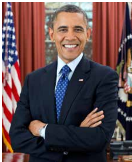
Barack Hussein Obama II ist ein US-amerikanischer Politiker der Demokratischen Partei und war von 2009 bis 2017 der 44. Präsident der Vereinigten Staaten. Quelle: https://de.wikipedia.org/wiki/Barack_Obama , Foto: Wikipedia, Lizenz: public domain

Wenn diese abgeschossen wurden, gab es eine Vorwarnzeit von etwa 10 Minuten. Bei Langstreckenraketen sind es immerhin 30 Minuten, aber bei einem so klei-