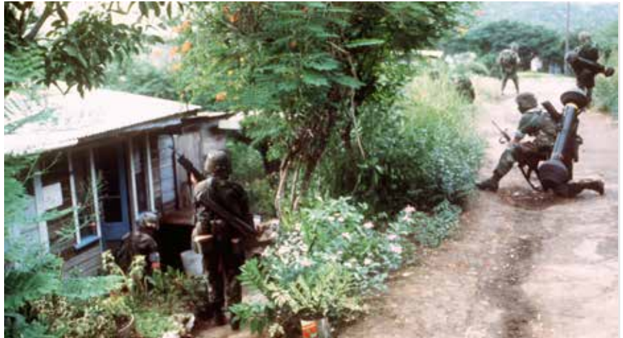
U. S. Army Soldaten auf Patrouille auf Grenada während der Operation „Urgent Fury“ im Oktober 1983.

PK: Es ist eigentlich noch viel schlimmer. Truman sagte bei mindestens drei Gelegenheiten ausdrücklich, dass ihm bewusst war, dass er etwas anstoßen würde, das alles Leben auf dem Planeten beenden könnte. Sein erstes großes Briefing zur Bombe – er war seit 82 Tagen Vizepräsident, wurde kaum beachtet und bis dahin nicht darüber in Kenntnis gesetzt, dass wir eine Atombombe bauen. Er erfährt erst, nachdem er bei der Notfall-Sitzung des Kabinetts in der Nacht des 12. April vereidigt wurde, von dem Bombenbauprojekt. Kriegsminister Stimson erwähnt es ihm gegenüber und räumt ein, er sei zu beschäftigt gewesen und habe das nicht wirklich auf dem Schirm gehabt. Am nächsten Tag fliegt Jimmy Byrnes aus South Carolina ein und informiert Truman über alles. In seinen Memoiren schreibt Truman, Jimmy Byrnes sprach von einer „Waffe, groß genug, um die ganze Welt zu zerstören“. Truman erhält am 25. April ein ausführliches Briefing von General Groves, dem Leiter des Manhattan-Projekts, und Kriegsminister Stim-