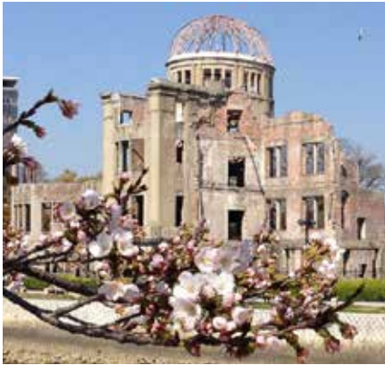
Das Friedensdenkmal in Hiroshima ( Hiroshima heiwa kinenhi ), auch Atombombenkuppel (engl. Atomic Bomb Dome, oft fälschlicherweise mit Atombombendom wiedergegeben), in der japanischen Küstenstadt Hiroshima ist eine Gedenkstätte für den ersten kriegerischen Einsatz einer Atombombe.

entschieden, dass wir ein Buch hinzufügen mussten, denn die Menge an Informationen, die wir in 58 Minuten und 30 Sekunden vermitteln konnten, war sehr frustrierend – auch wenn Oliver schnell sprach. Und da landeten wir also – zunächst dachten wir, wir setzen es als Bildband um, wie die Bücher von Ken Burns – aber dann wollten die Verleger alle ein richtiges Buch. Was mir auch mehr zusagte. Also haben wir am Ende ein 800-seitiges Buch geschrieben, das ich hier habe, ich glaube, Sie haben es gezeigt: The Untold History of the United States , und wir haben auch The Concise Untold History of the United States herausgebracht, was keine Kurzfassung ist, sondern lediglich auf den dokumentarischen Drehbüchern basiert.