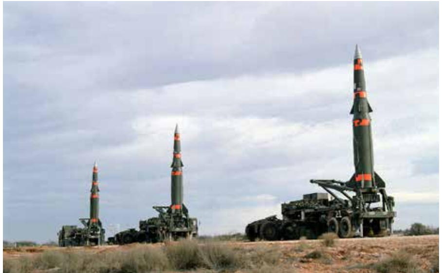
Die MGM-31 Pershing, oder auch einfach Pershingrakete, war eine ballistische militärische Rakete der Zeit des Kalten Krieges aus US-amerikanischer Produktion.

Ich bin gerade aus Indien zurückgekommen und wollte mich mit Rahul Gandhi treffen, aber wir haben es nicht geschafft. In Indien gibt es im Mai Neuwahlen. Es besteht eine gute Chance, dass Rahul Gandhi an der Spitze einer breiten progressiven Koalition der nächste Premierminister wird. Indien wird China in Bezug auf die Bevölkerungszahl bald überholen. Bis 2030 wird Indien die zweitgrößte Volkswirtschaft der Welt sein. Und Indien hat eine politische Tradition, die auf Gandhi und Nehru zurückgeht. Nehru führte nicht nur die Bewegung der Blockfreien Staaten gegen die USA und die Sowjetunion an, sondern auch die Bewegung für die Abschaffung von Atomwaffen und Einstellung der Atombombentests. Indien hat diese