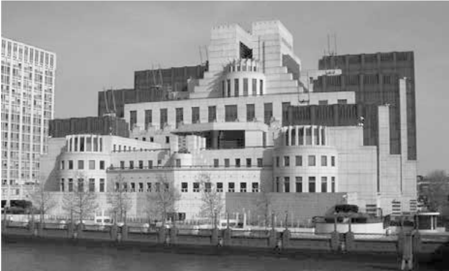
Die Aktivitäten des britischen SIS (Secret Intelligence Service), zu dem das im Falle Skripal aktive MI6 gehört, sind so legendär wie umstritten. Das SIS-Gebäude am Vauxhall Cross, London, von der Vauxhall Bridge aus gesehen.

ligen. Wenn der Westen nicht durch den Atomkrieg ausgelöscht wird, in den sie Russland ständig drängen, dann müssen Großbritannien und alle anderen NATO-Vasallenstaaten, die zu Unrecht Scharen russischer Diplomaten ausgewiesen haben, eines Tages Russland unterwürfig um Entschuldigung bitten und Entschädigung für das Elend zahlen, das dem russischen Volk durch ihre illegalen Sanktionen zugefügt wurde.