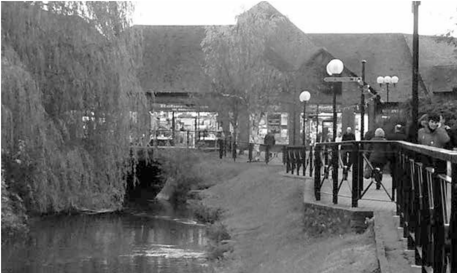
Das Einkaufszentrum in Salisbury, dessen außen installierte CCTV-Kameras entscheidende Hinweise zum Geschehen rund um den 4.3.2018 gegeben haben. Nicht alle Bilder dieser Kameras wurden bisher veröffentlicht. Die Bank, auf der die Skripals gefunden wurden, liegt in Sichtweite.

anders. Hysterischer Hass gegen Russland kann augenblicklich von den vom MI6 kontrollierten Medien und von den vom MI6 gehirngewaschenen Politikern entfacht werden. Jeder, der an der Schuld Russlands zweifelt, kann als Putin-Handlanger verunglimpft werden. Ob das Novichok per Kurier aus den USA geschickt oder in Porton Down produziert wurde, ist unwichtig. Entscheidend ist, dass der Versuch des MI6, die Skripals mit Novichok zu töten, katastrophal scheiterte.