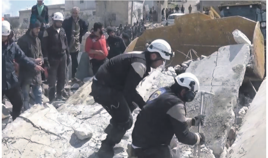
Die Weißhelme sind eine umstrittene private Zivilschutzorganisation von Freiwilligen und bezahlten Helfern in Syrien, die seit 2013 im Bürgerkrieg in nicht von der Regierung kontrollierten Teilen des Landes aktiv ist.

„Zunächst einmal hat HRW keine Untersuchung vor Ort durchgeführt. Die US-Menschenrechtsorganisation verließ sich in ihrer Analyse auf Bildmaterial, dass sie von den mit Al-Kaida verbundenen und vom Westen finanzierten Weißhelmen erhalten hatte – auch die wichtigs-