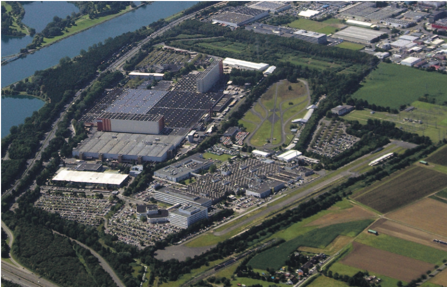
Ford-Entwicklungszentrum und europäisches Teilvertriebszentrum in Köln-Merkenich (August 2012).

wird wieder als Sammlung der „Mitte“ ausgegeben, obwohl sie nach rechts offen und gegen Links gerichtet war.