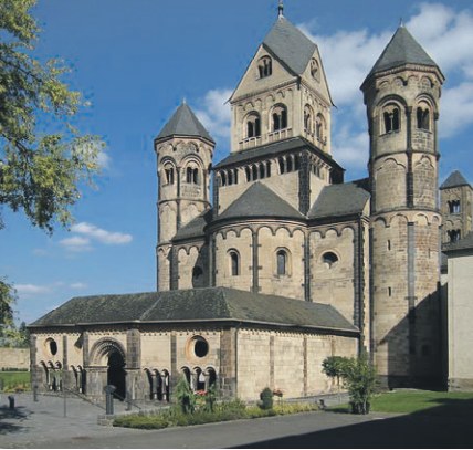
Westseite der Klosterkirche Maria Laach mit Paradies.