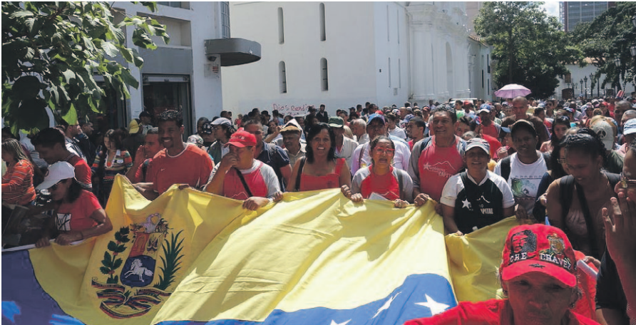
2016 Proteste gegen die Entfernung von Chávez- und Bolívar-Bildern aus der Nationalversammlung.

Im Jahr 2006 beschuldigte Channel 4 News im Grunde Chávez, mit dem Iran Atomwaffen zu bauen: Eine Fantasie. Der damalige Washingtoner Korrespondent Jonathan Rugman erlaubte unwidersprochen dem Kriegsverbrecher Donald Rumsfeld, Chávez mit Hitler zu vergleichen.