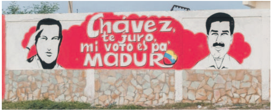
„Chávez, ich schwöre, ich werde Maduro wählen“.