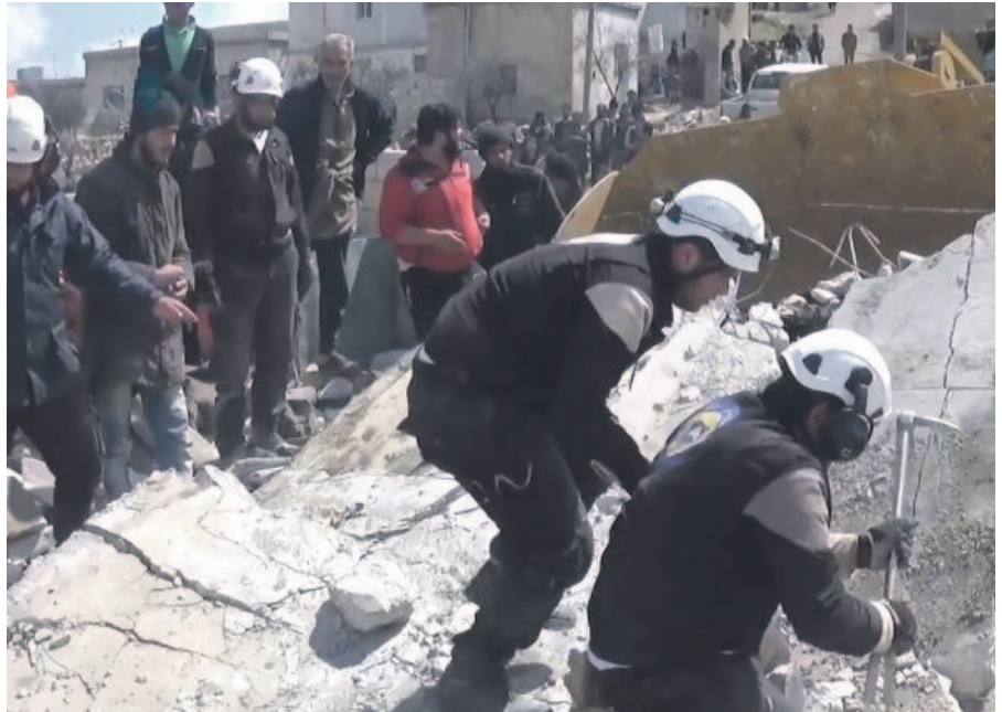
Weißer Helme der sogenannten syrischen Zivilverteidigung in Kafrowaid, einem Dorf südlich von Idlib, am 21. März 2017 – White helmets of the so-called Syrian civil defence in Kafrowaid, a village south of Idlib, on 21 March 2017