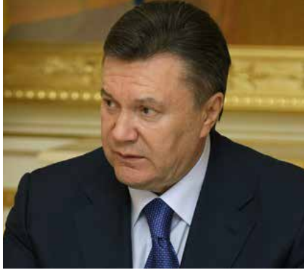
Der ehemalige ukrainische Präsident Viktor Janukowitsch

Es fällt auf, dass fünf Jahre nach dem Massaker niemand wegen Tötungen der Demonstranten und der Polizei auf dem Maidan verurteilt wurde. Immerhin ist es der am besten dokumentierte Fall von Massenmord in der Geschichte. Die Ermittler bestreiten einfach, dass es in den vom Maidan kontrollierten Gebäuden Scharfschützen gab. Das wird nicht untersucht, obwohl eigene Ermittlungen, das Verfahren und die öffentlich verfügbaren Beweise genau das feststellen. Zu den Belegen zählen Aussagen von über 100 verwundeten Demonstranten und über 200