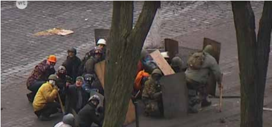
Ausschnitt aus den Aufnahmen des belgischen Senders VRT vom 20. Februar 2014 [9]: Vorrückende Maidankämpfer drehen sich nach Schüssen von hinten um und zeigen auf Schützen im Hotel Ukraina.

Schlüsselbeweis dafür, dass Demonstranten von Scharfschützen aus Maidan kontrollierten Gebäuden im Rücken und aus seitlichen Richtungen erschossen wurden und dass Berkut sie nicht getötet hat.