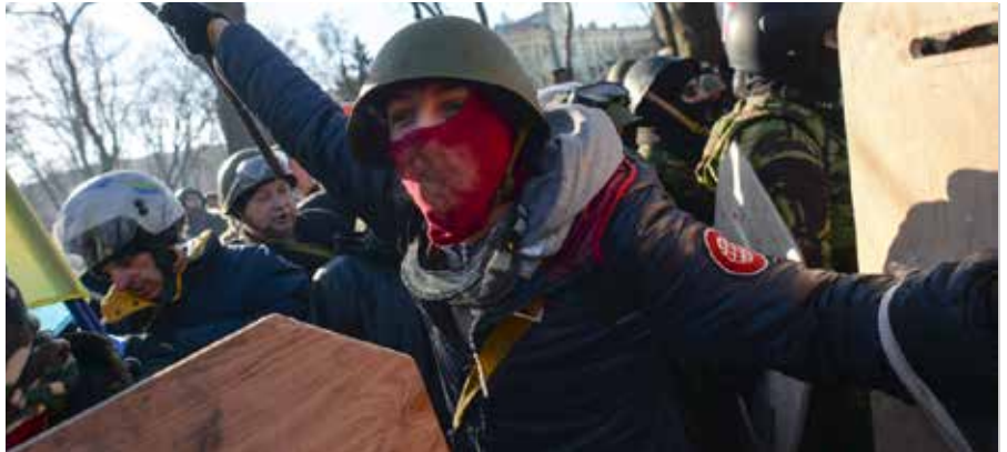
Das Phänomen von Faschisten in der Ukraine existiert seit der Orangen Revolution. Aber diese Netzwerke wurden schon über 50 Jahre lang vorbereitet, aufgebaut und unterstützt [19]

Ich begann mit meiner Untersuchung des Maidan-Massakers im Moment seines Geschehens, weil ich es über Inter-