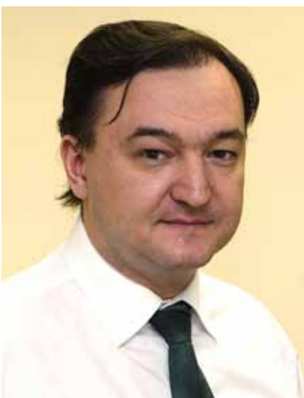
Sergei Leonidowitsch Magnitzki.

Im Interview berichtet Nekrasov, wie es zu dem Gesinnungswandel kam und