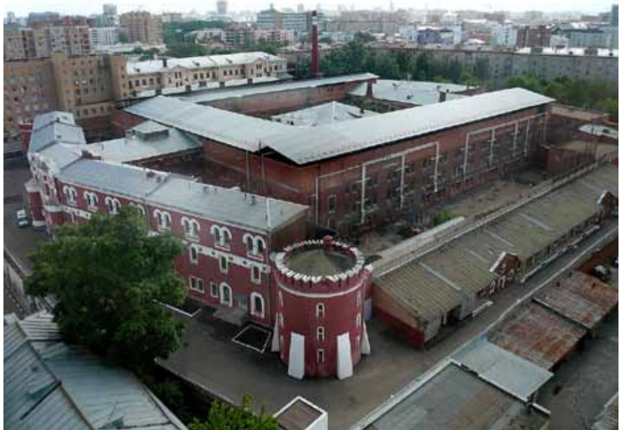
[11] Untersuchungshaftanstalt Nummer 2 „Butyrka“ in Moskau, in dem Magnitzki inhaftiert war.

nenne Dinge beim Namen, die im Westen eben nicht so gern gehört werden. Ein Freund Browders bin ich jetzt auf jeden Fall nicht mehr.