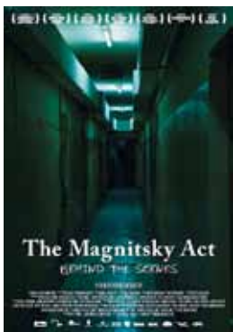
Das Filmcover der englischen Version.

„Wer die Wahrheit nicht weiß, der ist bloß ein Dummkopf. Aber wer sie weiß und sie eine Lüge nennt, der ist ein Verbrecher!