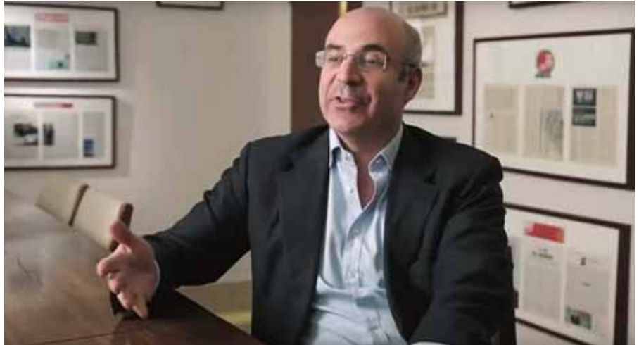
Bill Browder (Screenshot aus dem Trailer zur Dokumentation)

Sie steht schon seit Jahrhunderten für den Konflikt zwischen den Unterdrückten und dem russischen Staat. Viele unserer größten Dichter – Tolstoi oder Dostojewski als Beispiele genannt – befassten sich in ihren Werken mit der Auseinandersetzung zwischen dem autoritären Staat und dem gebildeten, intellektuellen Widerstand, der sich für die unterdrückten Massen engagierte. Autokraten als Feindbild der Intellektuellen, ob in der Zarenzeit, während des Kommunismus oder heute unter der Präsidentschaft von Putin. Diese Intelligenz forderte Freiheit und Demokratie und war begeistert von dem, was Jelzin und der Westen ihnen versprochen. Die Masse hatte zwar nicht genug zu essen – aber: „Hey – end-