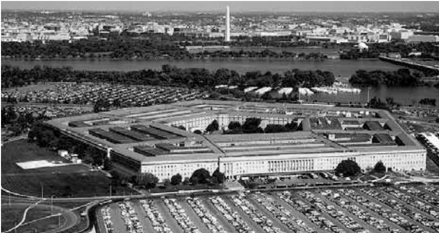
Das Pentagon; Sicht nach Nordosten mit dem Potomac River und Washington Monument im Hintergrund.

dar. Deshalb stehen die Herstellung der Einheit und die Sicherung der Souveränität des Landes durch ein starkes Militär an oberster Stelle.