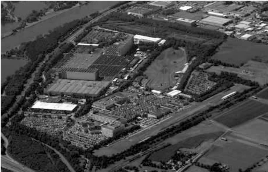
Ford-Entwicklungszentrum und europäisches Teilvertriebszentrum in Köln-Merkenich (August 2012). Quelle: https://de.wikipedia.org/wiki/Ford_Deutschland , Foto: Wikipedia, Lizenz: gemeinfrei.

wird wieder als Sammlung der „Mitte“ ausgegeben, obwohl sie nach rechts offen und gegen Links gerichtet war.