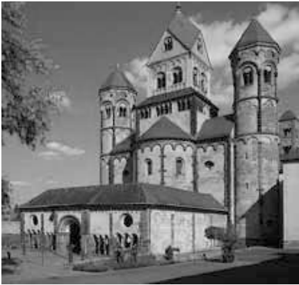
Westseite der Klosterkirche Maria Laach mit Paradies. Quelle: https://de.wikipedia.org/wiki/Abtei_Maria_Laach , Foto: Wikipedia, Lizenz: gemeinfrei.