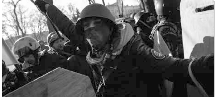
Das Phänomen von Faschisten in der Ukraine existiert seit der Orangen Revolution. Aber diese Netzwerke wurden schon über 50 Jahre lang vorbereitet, aufgebaut und unterstützt [19]

Ich begann mit meiner Untersuchung des Maidan-Massakers im Moment seines Geschehens, weil ich es über Inter-