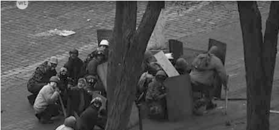
Ausschnitt aus den Aufnahmen des belgischen Senders VRT vom 20. Februar 2014 [9]: Vorrückende Maidankämpfer drehen sich nach Schüssen von hinten um und zeigen auf Schützen im Hotel Ukraina.

Schlüsselbeweis dafür, dass Demonstranten von Scharfschützen aus Maidan kontrollierten Gebäuden im Rücken und aus seitlichen Richtungen erschossen wurden und dass Berkut sie nicht getötet hat.