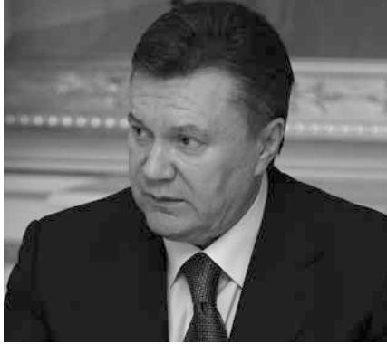
Der ehemalige ukrainische Präsident Viktor Janukowitsch

Es fällt auf, dass fünf Jahre nach dem Massaker niemand wegen Tötungen der Demonstranten und der Polizei auf dem Maidan verurteilt wurde. Immerhin ist es der am besten dokumentierte Fall von Massenmord in der Geschichte. Die Ermittler bestreiten einfach, dass es in den vom Maidan kontrollierten Gebäuden Scharfschützen gab. Das wird nicht untersucht, obwohl eigene Ermittlungen, das Verfahren und die öffentlich verfügbaren Beweise genau das feststellen. Zu den Belegen zählen Aussagen von über 100 verwundeten Demonstranten und über 200