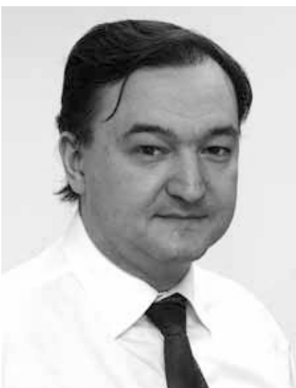
Sergei Leonidowitsch Magnitzki.

Im Interview berichtet Nekrasov, wie es zu dem Gesinnungswandel kam und