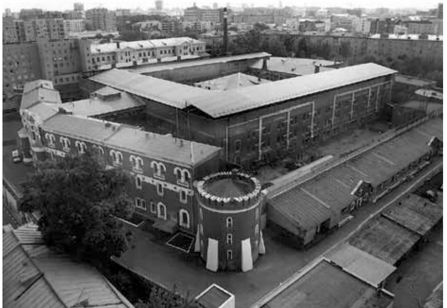
[11] Untersuchungshaftanstalt Nummer 2 „Butyrka“ in Moskau, in dem Magnitzki inhaftiert war.

nenne Dinge beim Namen, die im Westen eben nicht so gern gehört werden. Ein Freund Browders bin ich jetzt auf jeden Fall nicht mehr.