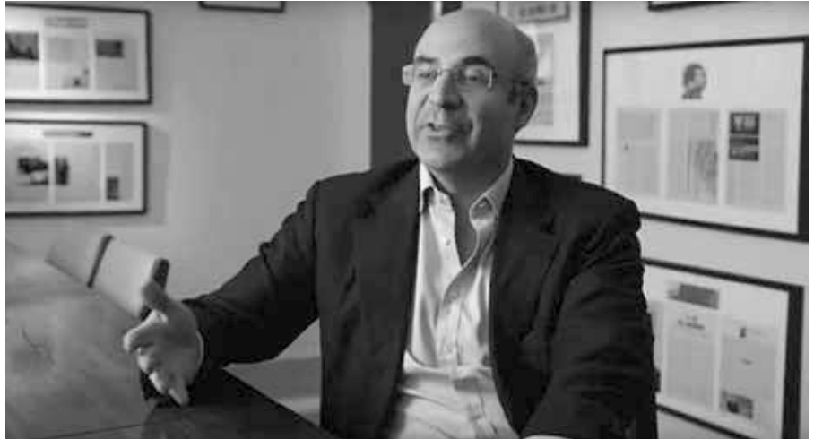
Bill Browder (Screenshot aus dem Trailer zur Dokumentation)

Sie steht schon seit Jahrhunderten für den Konflikt zwischen den Unterdrückten und dem russischen Staat. Viele unserer größten Dichter – Tolstoi oder Dostojewski als Beispiele genannt – befassten sich in ihren Werken mit der Auseinandersetzung zwischen dem autoritären Staat und dem gebildeten, intellektuellen Widerstand, der sich für die unterdrückten Massen engagierte. Autokraten als Feindbild der Intellektuellen, ob in der Zarenzeit, während des Kommunismus oder heute unter der Präsidentschaft von Putin. Diese Intelligenz forderte Freiheit und Demokratie und war begeistert von dem, was Jelzin und der Westen ihnen versprochen. Die Masse hatte zwar nicht genug zu essen – aber: „Hey – end-