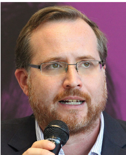
Der Autor der Süddeutschen Zeitung Tanjev Schultz

Doch die Sache ist zu ernst, um witzig zu sein. Das weiß auch der Rezensent der Süddeutschen, Tanjev Schultz, mit seinen 44 Jahren immerhin Professor für