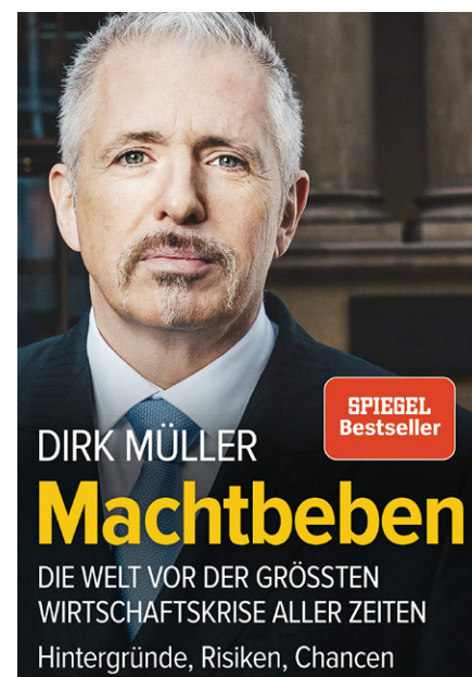
Buchcover „Machtbeben. Die Welt vor der größten Wirtschaftskrise aller Zeiten“ von Dirk Müller