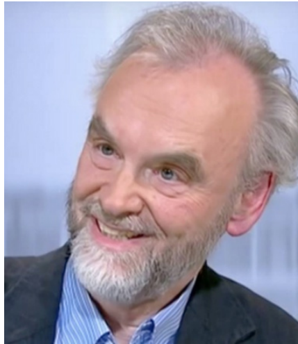
Rainer Mausfeld

Wem der Vergleich der millionenfach tödlichen Auswirkungen des historischen Faschismus und des gegenwärtigen Neoliberalismus dennoch unbehaglich ist, dem steht es frei, sachlich dagegen zu argumentieren. So könnte man etwa versuchen zu belegen, dass die von Ziegler genannten circa 50 Millionen Menschen, die jedes Jahr an Hunger, mangelnder Hygiene und Mangelkrankungen sterben, nicht auf das Konto der herrschenden Wirtschaftsordnung gehen, sondern