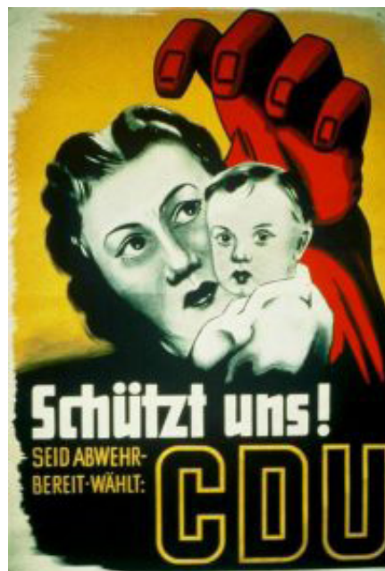
CDU-Plakat aus dem Jahre 1953. (Lizenz: KAS/ACDP 10-001: 414 CC-BY-SA 3.0 DE)

Genau. Es ist zwingend notwendig, dass investigative Journalisten aus Deutschland der Sache auf den Grund gehen. Es sieht jedenfalls so aus, das wird aus dem Dokument ersichtlich, dass von Salzen sich auf das Projekt eingelassen hat. In dem