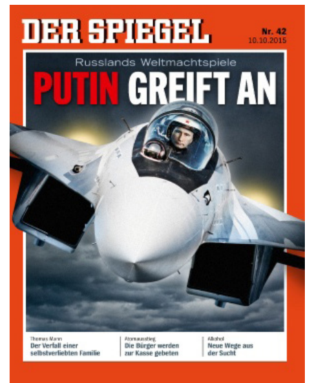
Antirussische Propaganda-Beispiele in der Presse aus den letzten vier Jahren.

Woher wissen Sie, dass die Dokumente echt, also kein Fake sind?