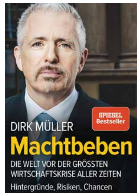
Buchcover „Machtbeben. Die Welt vor der größten Wirtschaftskrise aller Zeiten“ von Dirk Müller