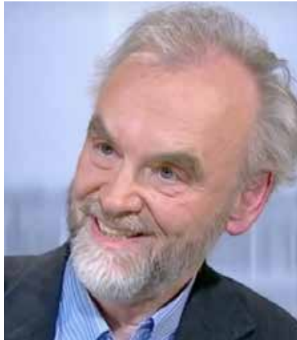
Rainer Mausfeld

Wem der Vergleich der millionenfach tödlichen Auswirkungen des historischen Faschismus und des gegenwärtigen Neoliberalismus dennoch unbehaglich ist, dem steht es frei, sachlich dagegen zu argumentieren. So könnte man etwa versuchen zu belegen, dass die von Ziegler genannten circa 50 Millionen Menschen, die jedes Jahr an Hunger, mangelnder Hygiene und Mangelkrankungen sterben, nicht auf das Konto der herrschenden Wirtschaftsordnung gehen, sondern