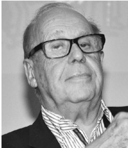
Jean Ziegler