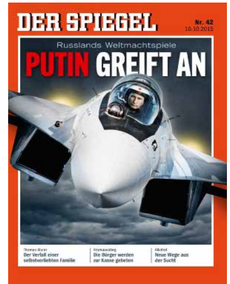
Antirussische Propaganda-Beispiele in der Presse aus den letzten vier Jahren.

Woher wissen Sie, dass die Dokumente echt, also kein Fake sind?