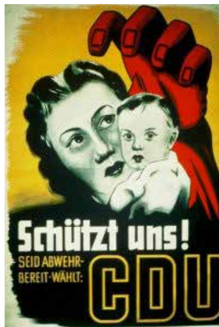
CDU-Plakat aus dem Jahre 1953.

Genau. Es ist zwingend notwendig, dass investigative Journalisten aus Deutschland der Sache auf den Grund gehen. Es sieht jedenfalls so aus, das wird aus dem Dokument ersichtlich, dass von Salzen sich auf das Projekt eingelassen hat. In dem