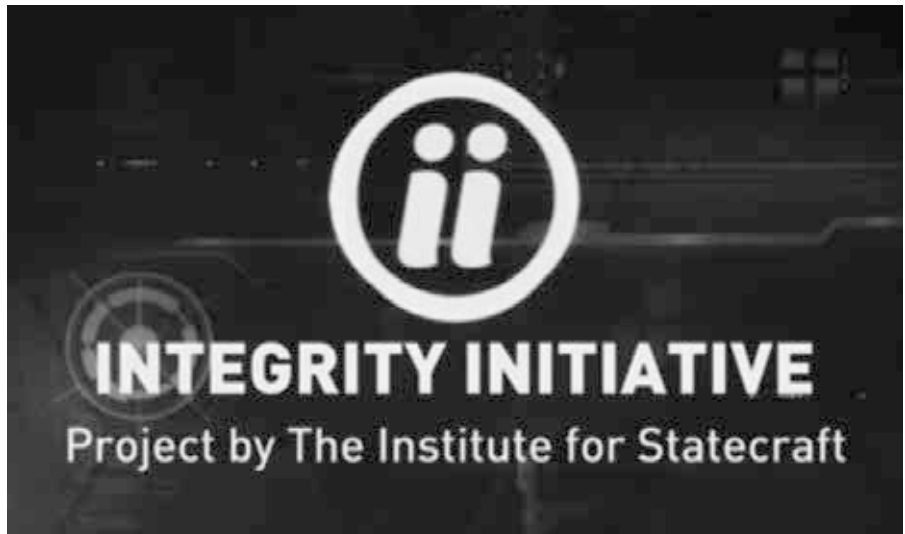
Bild oben: Screenshot von RT. Bild unten: Seite 1 (Ausschnitt) des geleakten Zwischenberichtes von Hannes Adomat, dem Gründer des deutschen „Clusters“ der Integrity Initiative

Die geleakten Dokumente zur „Integrity Initiative“ zeigen auf erschreckende Art und Weise, mit welchem Selbstverständnis Meinungsmacher aus dem Umfeld der NATO heute ihre PR-Netzwerke bis tief hinein in die Redaktionen deutscher Medien aufbauen. Mindestens ebenso erschreckend ist es jedoch, dass – fast – kein deutsches Medium diesen Skandal aufgreift. Die NachDenkSeiten hatten die Gelegenheit, einen ausführlichen Blick in den Zwischenbericht der deutschen Zelle von Integrity Initiative zu werfen.