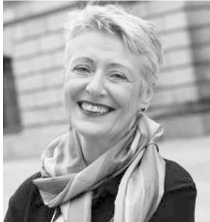
Marieluise Beck