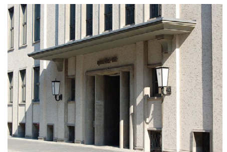
Der Sitz des Deutschen Instituts für Wirtschaftsforschung in Berlin-Mitte.

Fünf der acht von Bogai untersuchten Studien kommen hingegen zu negativen Lohneffekten und quantifizieren sie auch. Die Untersuchung von Haisken-DeNew