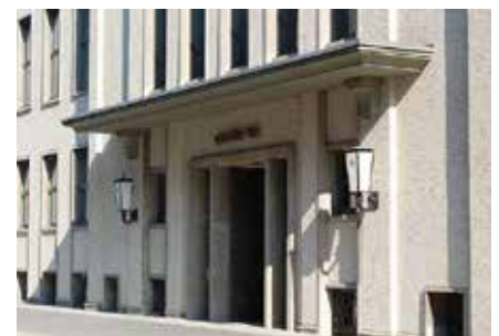
Der Sitz des Deutschen Instituts für Wirtschaftsforschung in Berlin-Mitte.

Fünf der acht von Bogai untersuchten Studien kommen hingegen zu negativen Lohneffekten und quantifizieren sie auch. Die Untersuchung von Haisken-DeNew