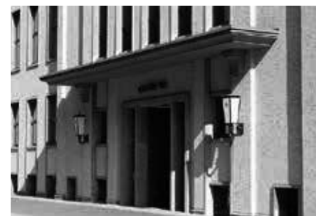
Der Sitz des Deutschen Instituts für Wirtschaftsforschung in Berlin-Mitte.

Fünf der acht von Bogai untersuchten Studien kommen hingegen zu negativen Lohneffekten und quantifizieren sie auch. Die Untersuchung von Haisken-DeNew