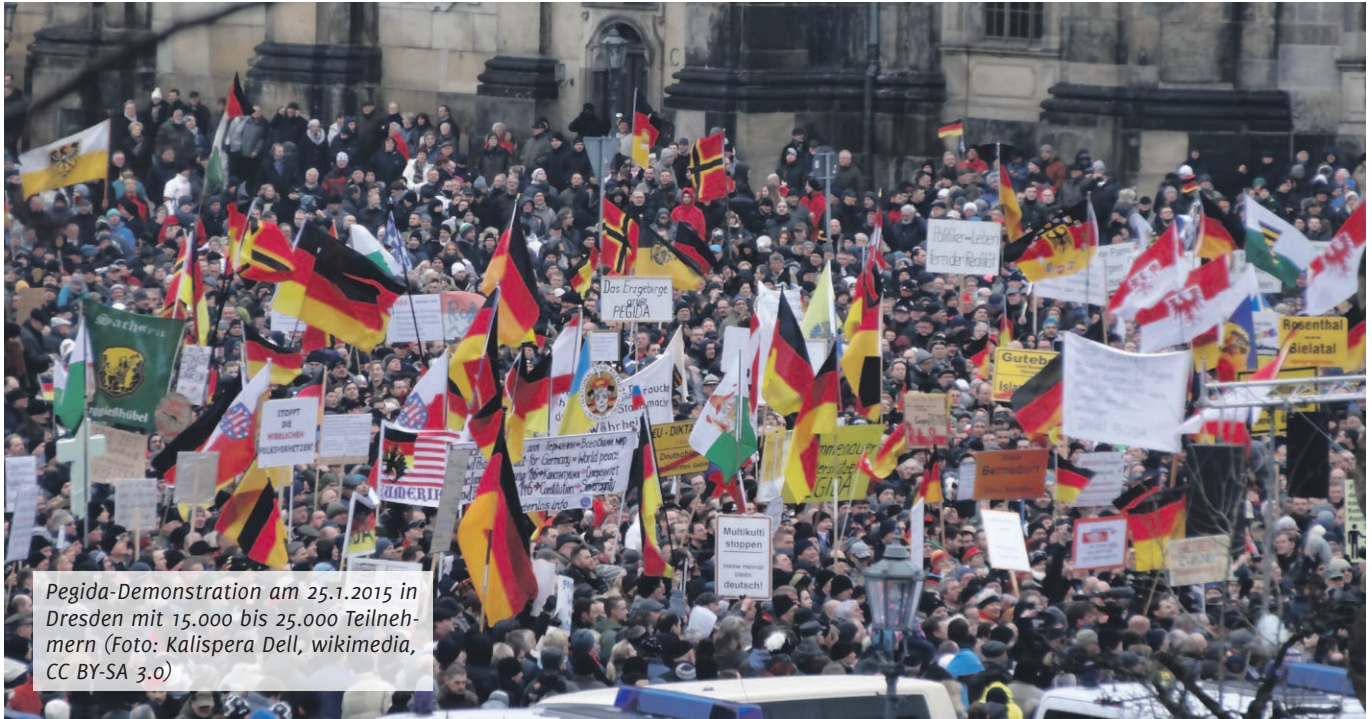
Pegida-Demonstration am 25.1.2015 in Dresden mit 15.000 bis 25.000 Teilnehmern