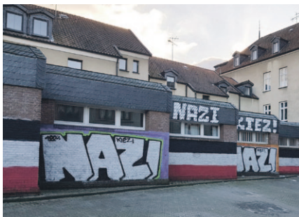
„Eine Straße mitten in Dortmund-Dorstfeld. Hier markieren Nazis regelmäßig ein Revier, das sie gerne kontrollieren wollen.“ (Foto und Text: Michael Bonvalot, Twitter, CC BY-NC)

Rassismus und auch Neonazis sind also mitnichten nur ein ostdeutsches Problem. Angesichts des Schweigens zu Dortmund