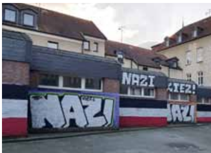
„Eine Straße mitten in Dortmund-Dorstfeld. Hier markieren Nazis regelmäßig ein Revier, das sie gerne kontrollieren wollen.“ (Foto und Text: Michael Bonvalot, Twitter, CC BY-NC)

Rassismus und auch Neonazis sind also mitnichten nur ein ostdeutsches Problem. Angesichts des Schweigens zu Dortmund