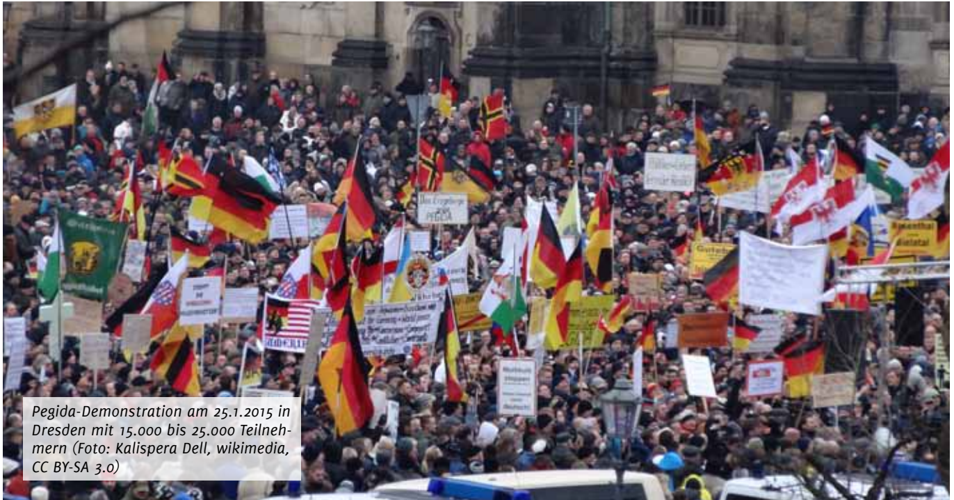
Pegida-Demonstration am 25.1.2015 in Dresden mit 15.000 bis 25.000 Teilnehmern