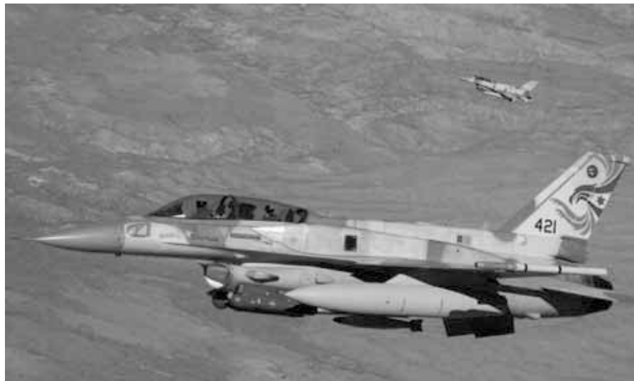
F-16 der israelischen Luftwaffe von der Ramon Air Base, Israel

se Russland (12). Andere Quellen gehen davon aus, dass sogar bis zu einem Viertel aller Einwohner Israels von dort stammen (13). Angesichts dessen scheint es mir zu simpel, von einer gegenseitigen Feindkennung der beiden Staaten auszugehen. Wie aggressiv auch Israel gegenüber Syrien auftrat, so bedacht war es, nicht mit dem russischen Militär in Konflikt zu geraten. Bis zum 17. September 2018 funktionierte das im Großen und Ganzen. Russland war seinerseits bemüht, verlässliche Beziehungen mit Israel zu pflegen und das bekam auch Syrien zu spüren. Schon 2010 hatten Russland und Syrien einen Vertrag zur Lieferung von S-300 für das Jahr 2013 abgeschlossen, der auf Drängen Israels dann doch zurückgestellt wurde (14,15). Als die Luftverteidigung Syriens von den westlichen Verbündeten, einschließlich Israels, seit 2017 immer intensiver ausgetestet wurde, kam das Thema S-300 im Frühjahr erneut ins Gespräch. Wieder sagte Russland den Israelis zu, die Lieferung des hochmodernen Waffensystems zu verschieben (16). Dass sich pro-iranische Kräfte – Berater und Milizen – aus einer 85 Kilometer breiten Zone von der israelischen Grenze entfernten und so eine relativ unkomplizierte Befriedung Südsyriens im Sommer 2018 ermöglichten, ist mit Sicherheit ebenfalls dem russischen Verhandlungsgeschick, einschließlich intakter Beziehungen zu Israel, zu verdanken (17,a2).