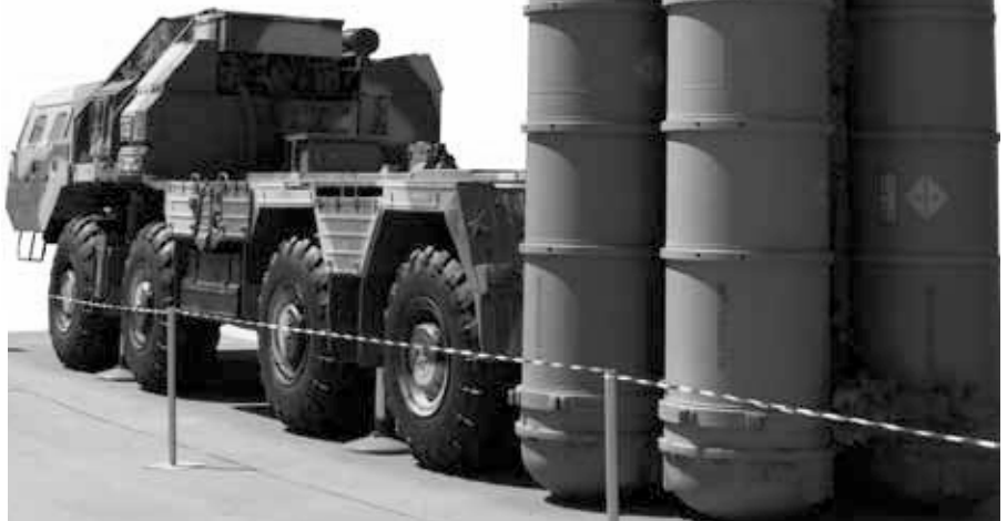
Die Raketenstartanlage des russischen Luftabwehrraketensystems S-300P

Russland hat starke Verbindungen zu Israel. Israels Bevölkerung hat sich in den letzten drei Jahrzehnten mehr als verdoppelt (11). Von acht Millionen Israelis haben etwa 1,5 Millionen Wurzeln in der ehemaligen Sowjetunion beziehungsweise