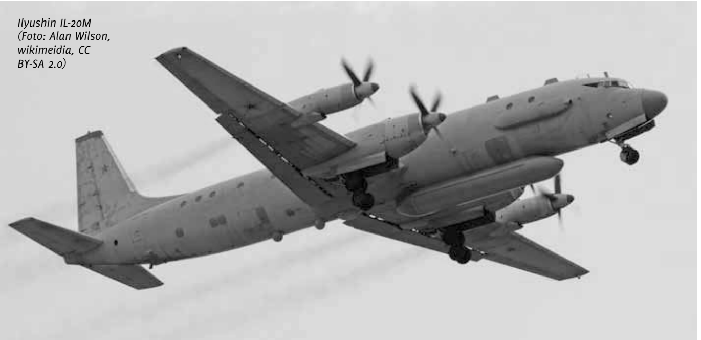
Ilyushin IL-20M