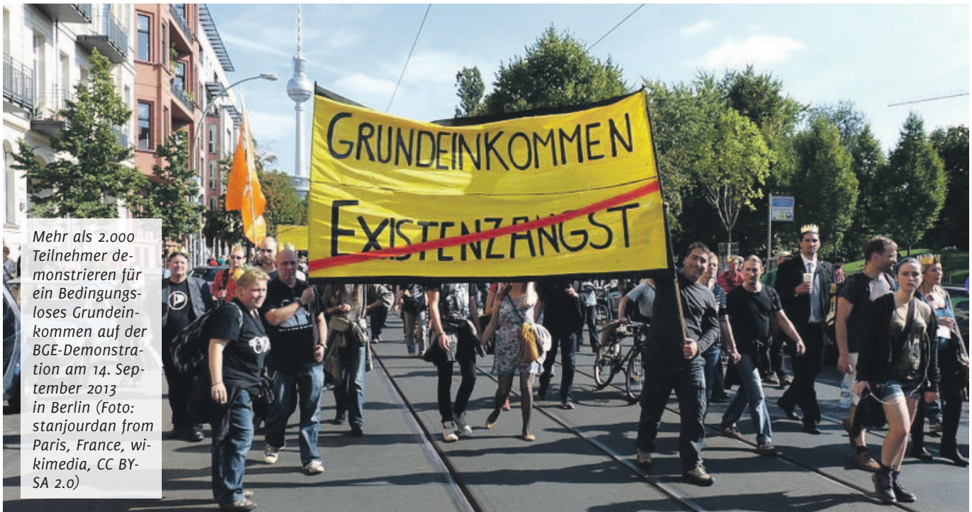
Mehr als 2.000 Teilnehmer demonstrieren für ein bedingungsloses Grundeinkommen auf der BGE-Demonstration am 14. September 2013 in Berlin

Gewerkschaftliche Argumente gegen das Grundeinkommen: