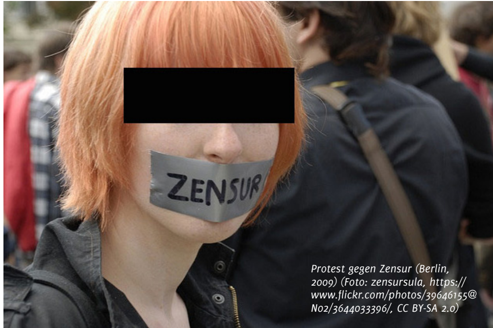
Protest gegen Zensur (Berlin, 2009)