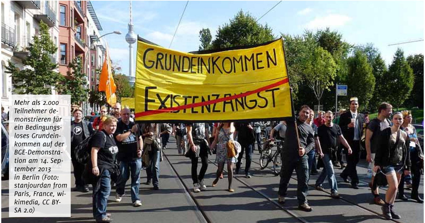
Mehr als 2.000 Teilnehmer demonstrieren für ein bedingungsloses Grundeinkommen auf der BGE-Demonstration am 14. September 2013 in Berlin

Gewerkschaftliche Argumente gegen das Grundeinkommen: