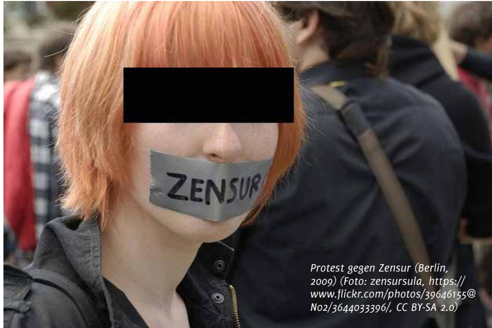
Protest gegen Zensur (Berlin, 2009)